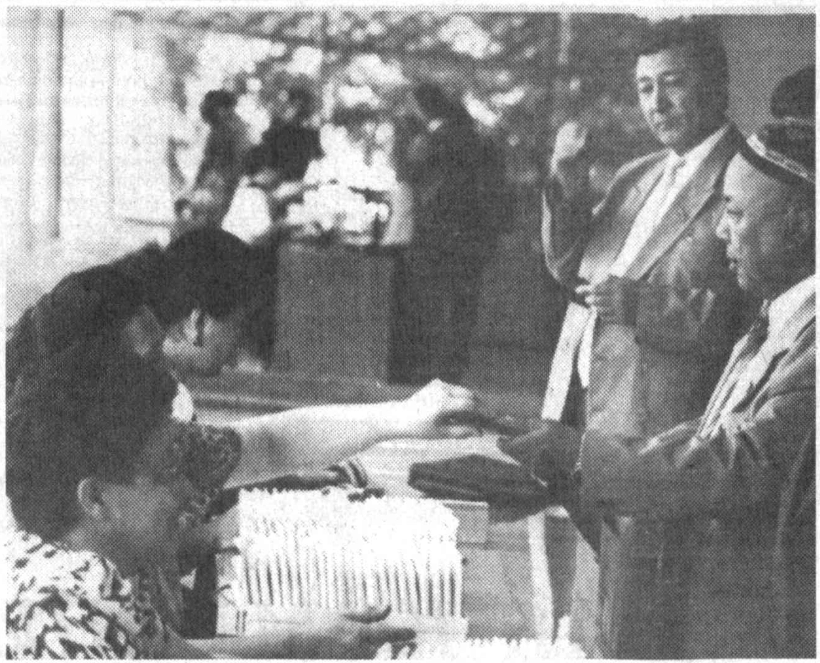
Во время регистрации депутатов.

депутатами на заседаниях Комитета Олий Мажлиса по труду и социальной защите населения. Поступило около 150 предложений, замечаний от депутатов, представителей министерств, ведомств, общественных организаций. В свое время мы получили