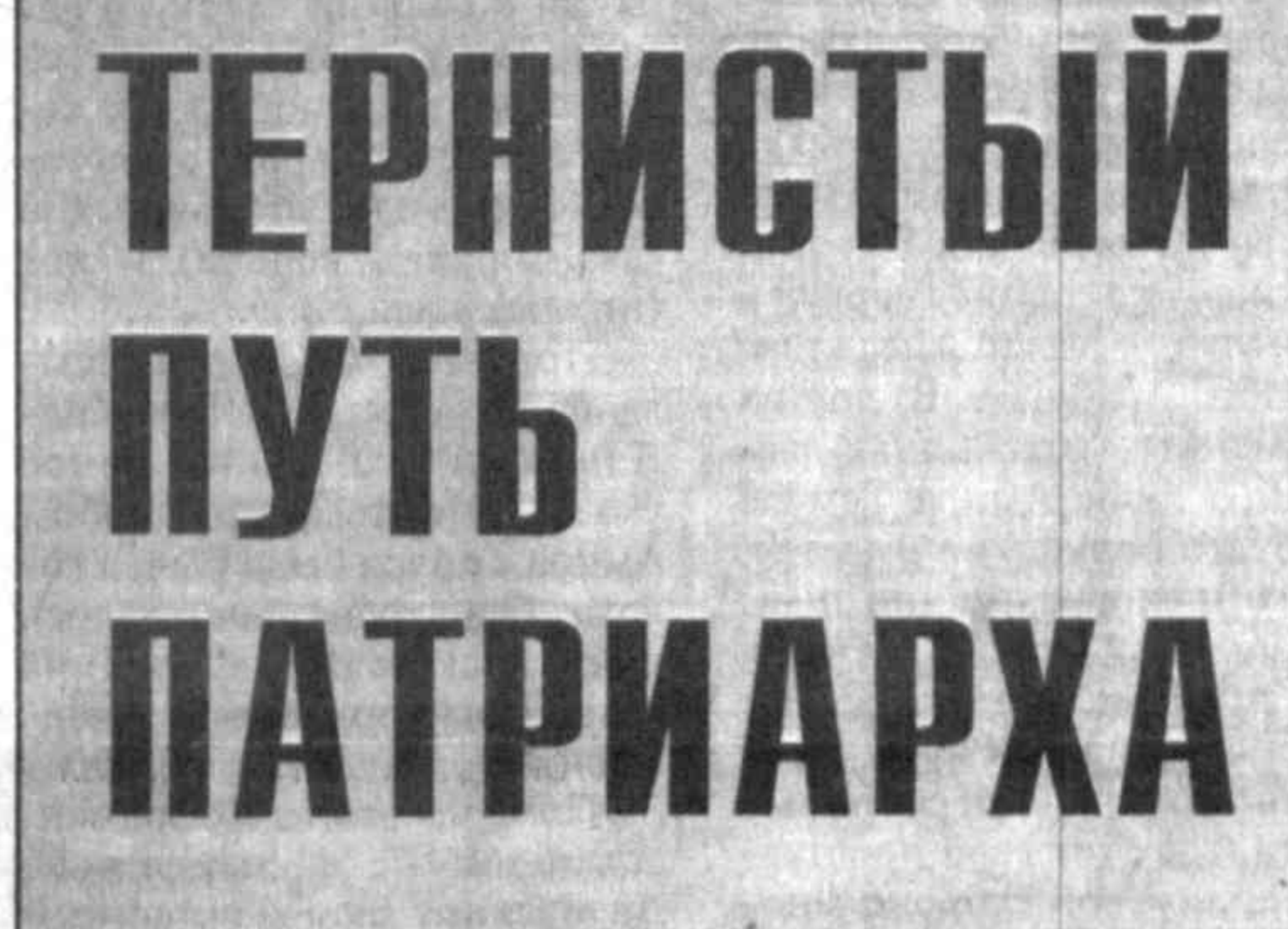
Тернистый путь патриарха

качества. Он создавал все условия желающим заниматься наукой, потому что в каждом из них видел будущее Узбекистана.