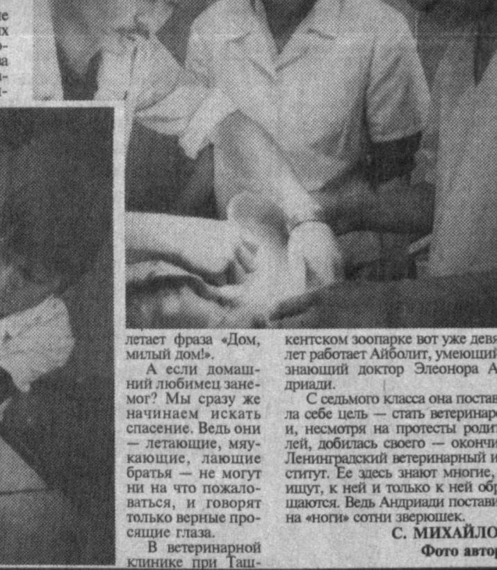
летает фраза «Дом, милый дом». Если домашний любимец заболел...