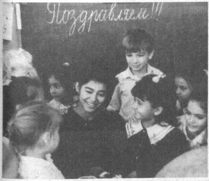
Сегодня все учителя — именные.