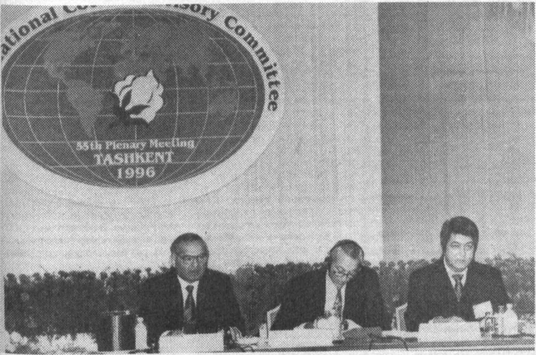
В Ташкенте 7 октября открылось 55-е пленарное заседание Международного консультативного комитета по хлопку.