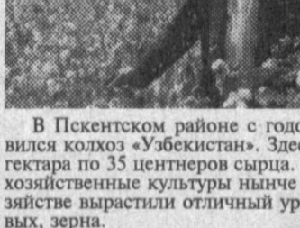
Кулиничинского района, с их помощью ежегодно собирают по 500 тонн сырья. Хорошо зарекомендовали себя американские комбайны «Кейс» в опытно-фермерском объединении «Узбекистан»: они оказались высокопроизводительными, надежными.

А. ХАТАМОВ, соб. корр. «Народного слова».