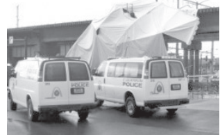
Унинг кулашига кучли шамол сабаб бўлгани айтилмоқда.

Шаҳар ўт ўчириш департаменти томонидан маълум қилинишича, жабрланганларнинг ўн етти нафари касалхонага олиб кетилган.