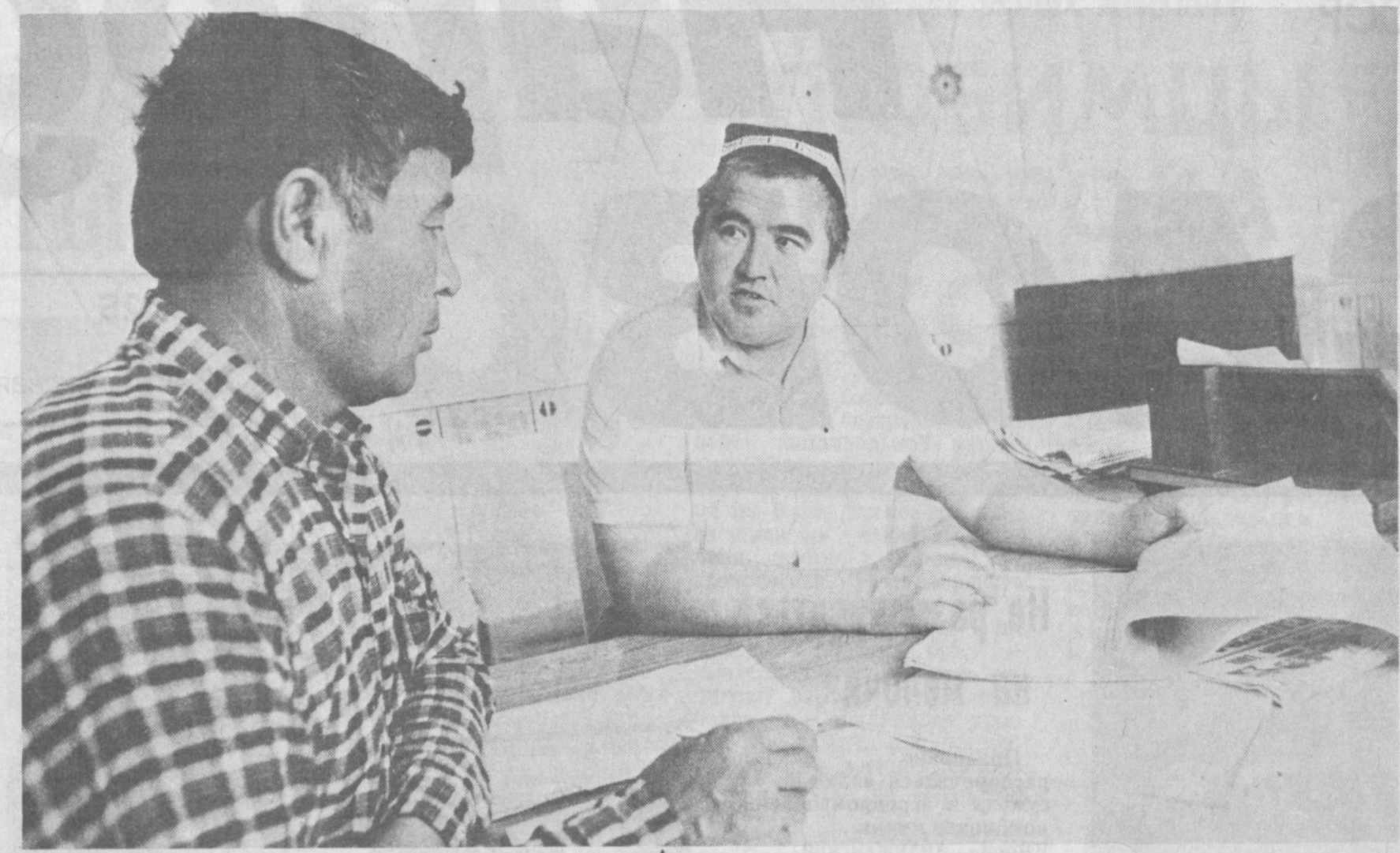
Указ Президента: механизм исполнения

И понятно беспокойство за отечественную экономику наших, пока немногочисленных, деловых и предпринимательских людей, их стремление поставить ее на рельсы безотходной технологии.