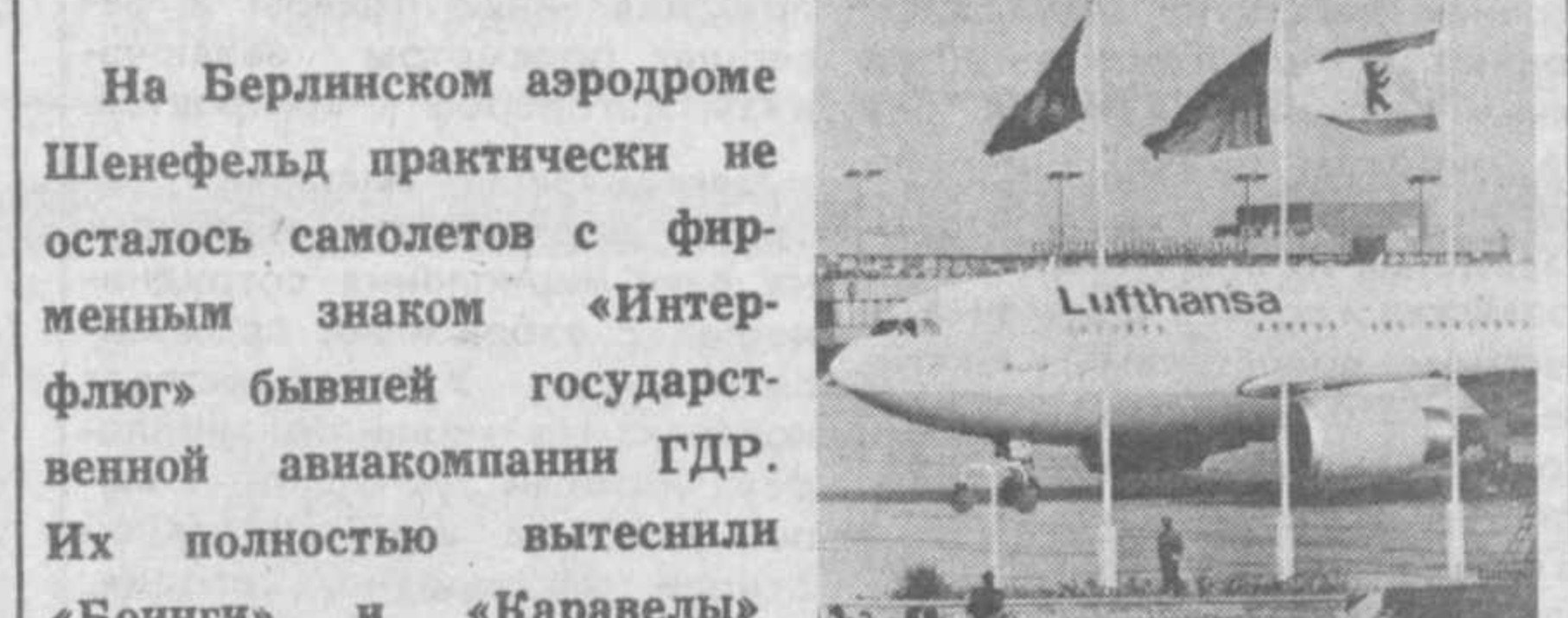
На Берлинском аэродроме Шенефельд практически не осталось самолетов с фирменным знаком «Интерфлюг» бывшей государственной авиакомпании ГДР.

КОНТИНЕНТАЛЬНЫЕ НОВОСТИ: ЕВРОПА В Праге страны — члены Варшавского Договора подписали протокол о прекращении действия договора от 14 мая 1955 года.