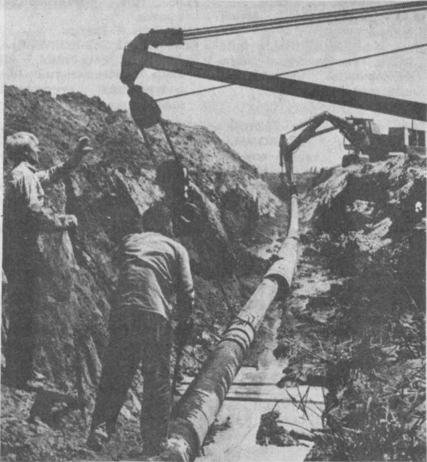
— Спасибо этим ребятам, что трудятся на совесть, не зная ни дня отдыха. Благодаря им и в наши села придет цивилизация.