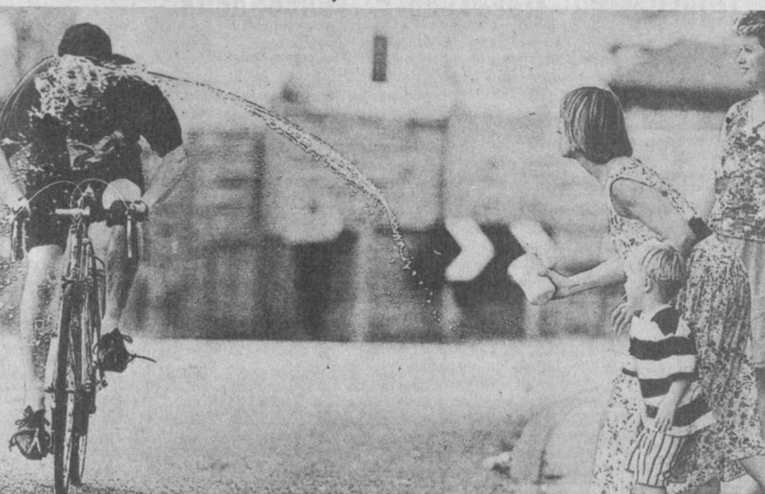
АНГЛИЯ. Ваша первая реакция — Тетянка хулиганит на улице. Да еще при ребенке, обливая проезжего велосипедиста водой? Вы ошиблись. Вглядитесь. Парень в кепке улыбается. И все объясняется очень просто. В городе Бирмингеме проходили соревнования велосипедистов.