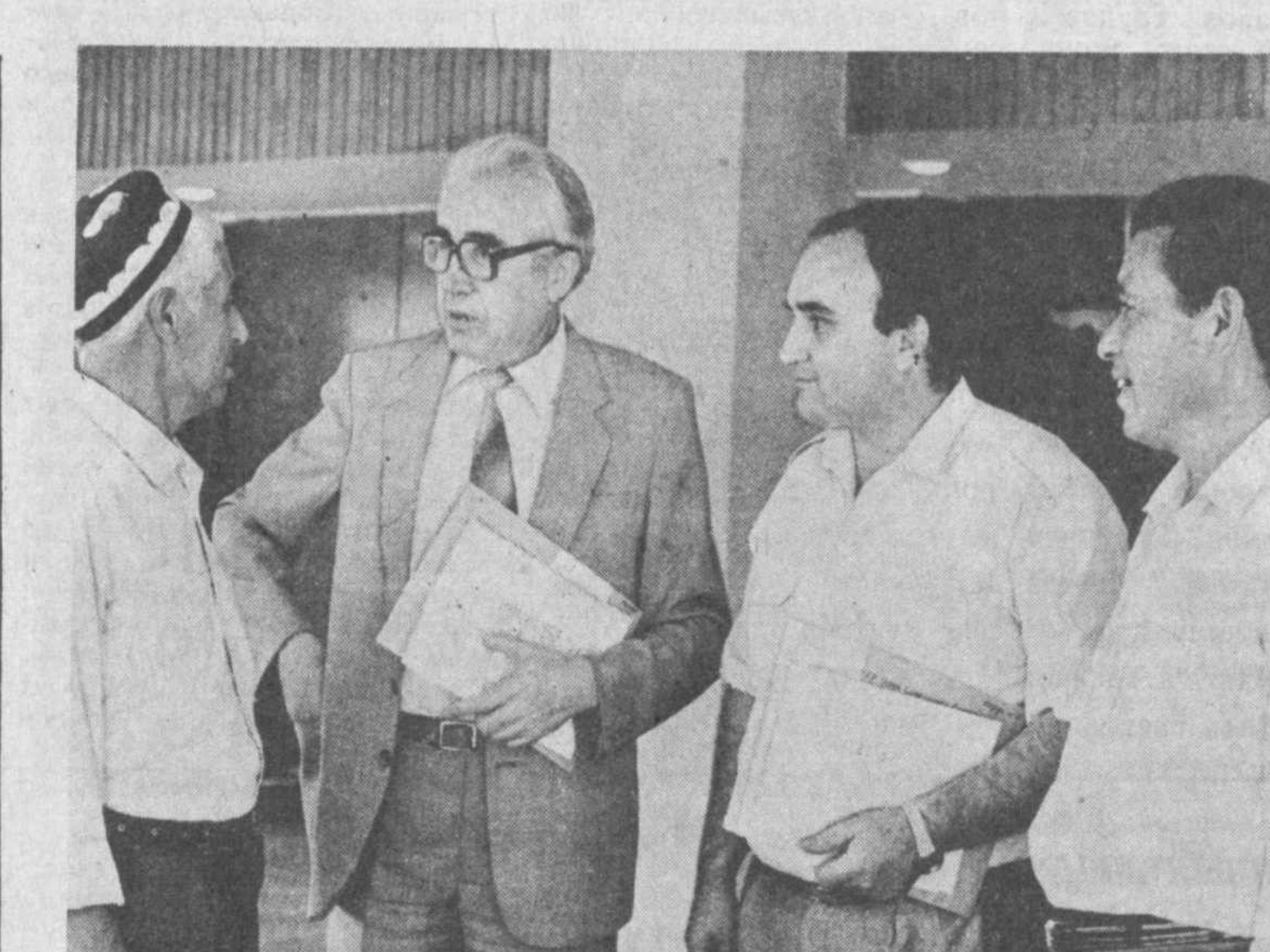
НА СНИМКАХ: народные депутаты республики, прибывшие на внеочередную сессию Верховного Совета Узбекской ССР; во время регистрации.

Мне кажется, что сегодня над щедрой и прекрасной землей Узбекистана солнце встало раньше, чем всегда, его лучи озаряют нам путь в будущее.