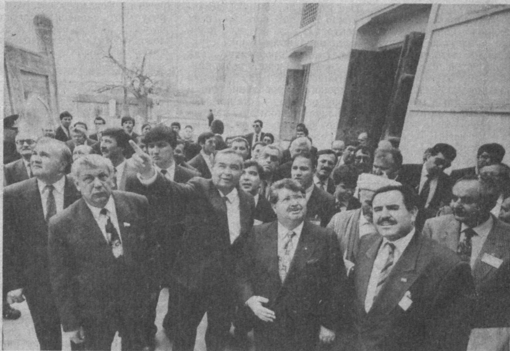
НА СНИМКЕ: во время поездки в Бухару.