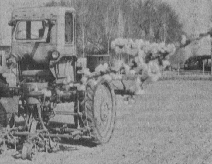
НА СНИМКАХ: механизатор Ш. Сабиров; идет сев хлопчатника.