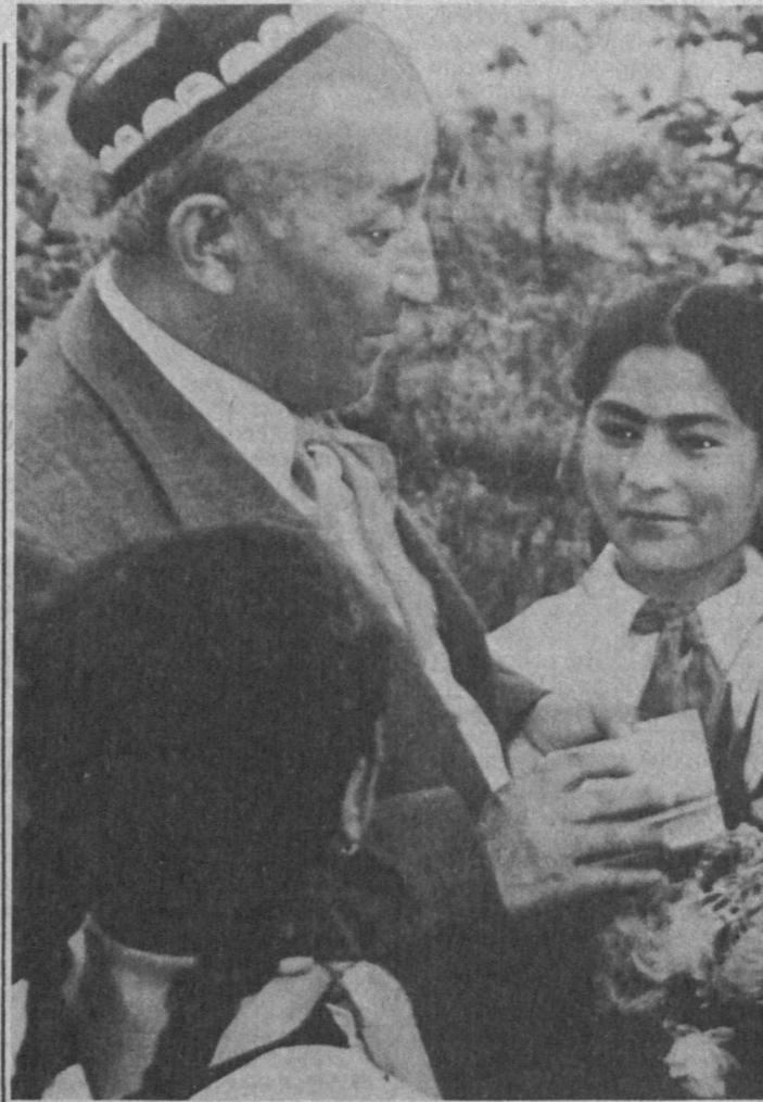
Общественность республики готовится широко отметить 90-летие известного узбекского поэта Гафура Гуляма. НА СНИМКЕ: Гафур Гулям беседует со школьниками.