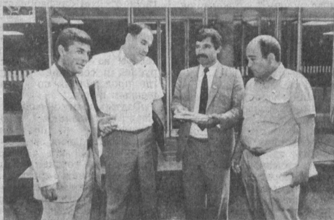
Этот снимок сделан вчера, у здания Верховного Совета Республики Узбекистан, где проходила регистрация народных депутатов, прибывших на сессию. Много забот у депутатов, в значительной мере им поговорить.

Внедрена плата за пользование животным миром. Рассматривается вопрос о плате за заготовку диких ле-