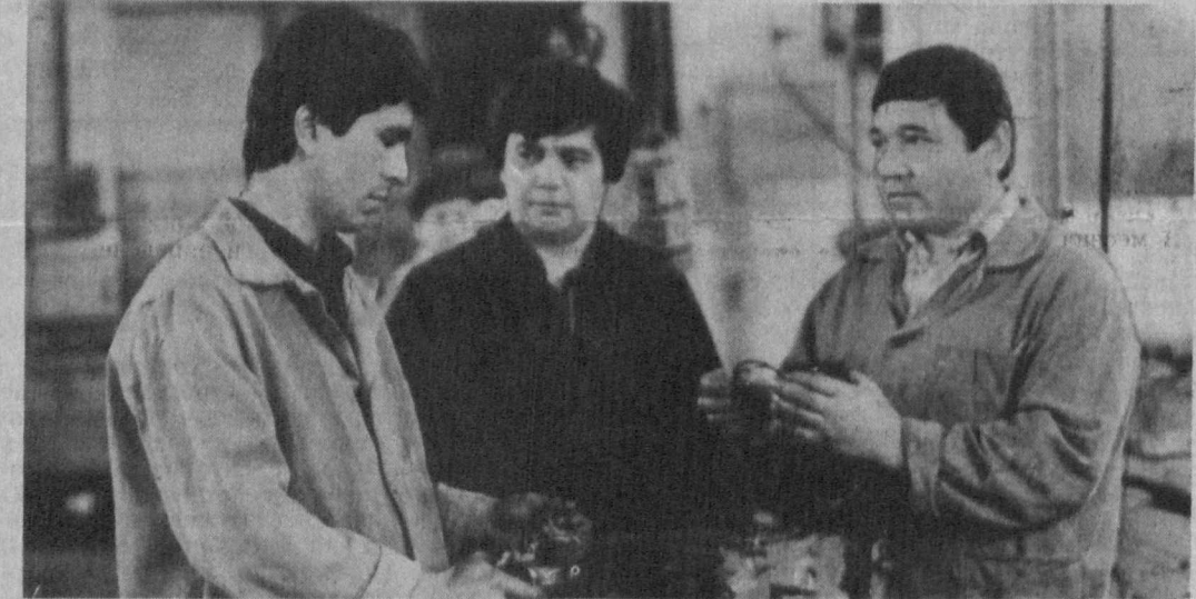
Двадцать лет назад была создана Ташкентская станция по техническому обслуживанию «Игулей». Трудно подсчитать, сколько за это время возросло «и жизни» машин Волжского автозавода. Сейчас мастера, пришедшие сюда в 70-х годах, робинизы учениками, стали высококлассными специалистами, до тонкости разбирающимися в каждой детали. И потому не уменьшается поток клиентов, желающих попасть в сервисную службу именно к этим мастерам.

В большом многоотраслевом хозяйстве закладываются прочный фундамент урожая. Что ж, все правильно, весенний день — он год корнит. А трудолюбиво, как известно, Бог посылает. В. ПАНАМАРЕВ. Ферганская область.