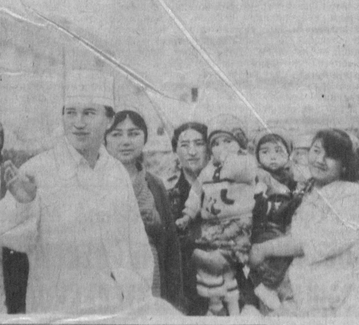
Факт и комментарий. Сотрудничать стандартизаторы.

Ученые в области молекулярной генетики ведут большую работу по трем основным направлениям защиты генофонда человека. И в первую очередь — это экология, которая во многом зависит в республике от интенсивного развития сельского хозяйства. Сделать экологически чистыми выращивание и переработку хлопчатника и других сельскохозяйственных культур — значит по-настоящему решить вопрос оздоровления населения. Узбекские ученые в совместных работах с немецкими генетиками нашли в растении ключевой ген, благодаря которому, воздействуя на него определенными гормонами, можно добиться полного самоопадания листьев — тогда будет, наконец, полностью исключено использование гербицидов. С учеными США генетики Узбекистана разработали совместный проект научных исследований по созданию хлопчатника, устойчивого одновременно к грибковым заболеваниям, к сосушкам и грызущим сельхозвредителям. Ориентировочный прототип такого растения будет получен для полевых испытаний лет через пять. А это значит, что хлопководы избавятся и от использования инсектицидов и пестицидов.