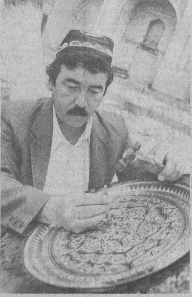
БУХАРСКАЯ ОБЛАСТЬ. Более 30 видов изделий, среди которых медные и бронзовые ланганы, подвесы, светильники, вазы, кувшины, ювелирные украшения, различные сувениры выпускают в бухарской мастерской «Юнданор».

В течение первой недели мая в Ташкенте зарегистрировано 325 уголовных преступлений, из них 258 раскрыты по «горячим следам». Как свидетельствуют оперативные сводки, участились кражи личного и государственного имущества. Так, глубокой ночью, разобрав крышу магазина № 47, гражданин П. совершил кражу семи наручных часов. Реализовать ходовой товар не удалось. Любитель ночных приключений — ранее судимый и ныне не работающий П. задержан.