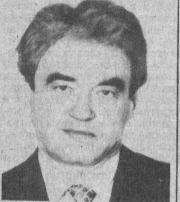
Сланский Рудольф родился 6 февраля 1935 года в Праге.

К ВРУЧЕНИЮ ВЕРИТЕЛЬНЫХ ГРАМОТ ЧРЕЗВЫЧАЙНОГО И ПОЛНОМОЧНОГО ПОСЛА ЧЕШСКОЙ РЕСПУБЛИКИ В РЕСПУБЛИКУ УЗБЕКИСТАН РУДОЛЬФ СЛАНСКИЙ