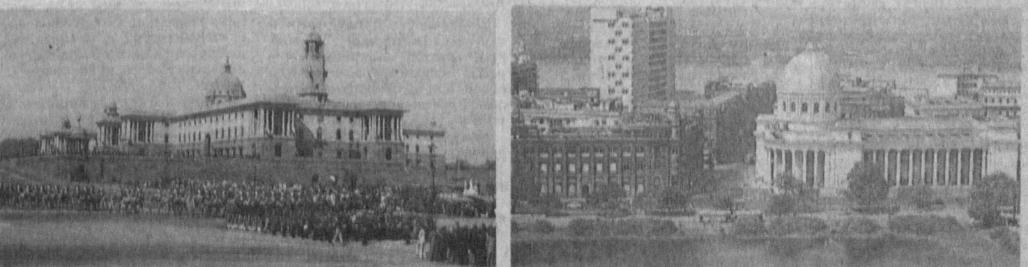
НА СНИМКАХ: Индия сегодня.