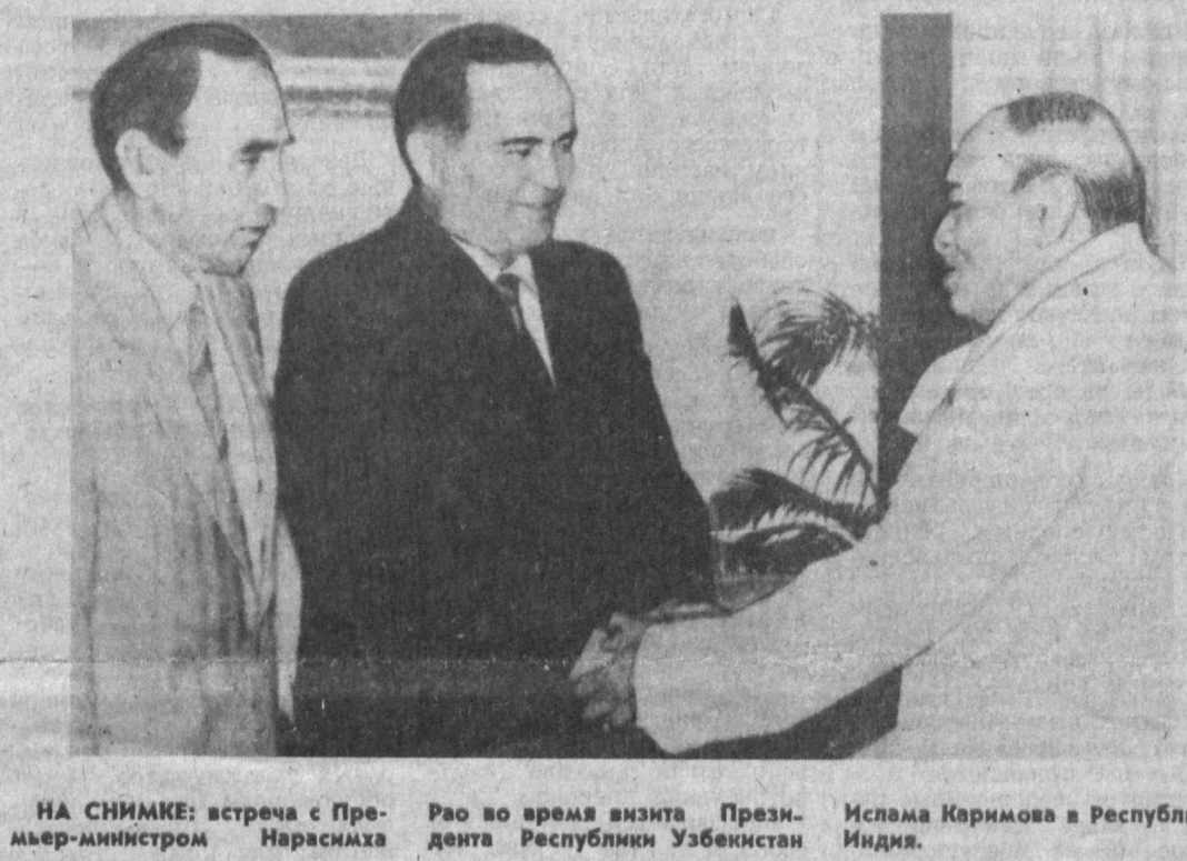
НА СНИМКЕ: встреча с Премьер-министром Нарасимха Рао во время визита Президента Республики Узбекистан Ислама Каримова в Республику Индия.