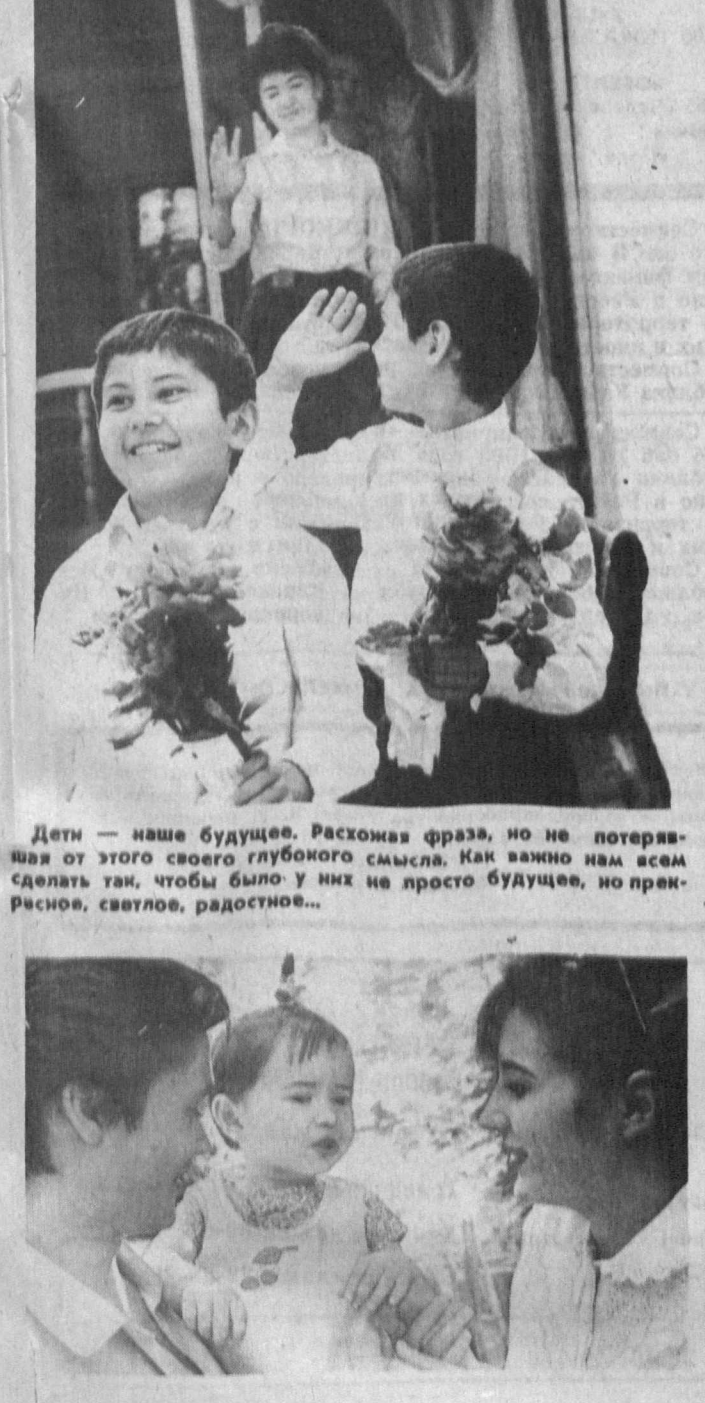
Дети — наше будущее. Расхожая фраза, но не потерявшая от этого своего глубокого смысла. Как важно нам всем сделать так, чтобы было у них не просто будущее, но настоящее, светлое, радостное...