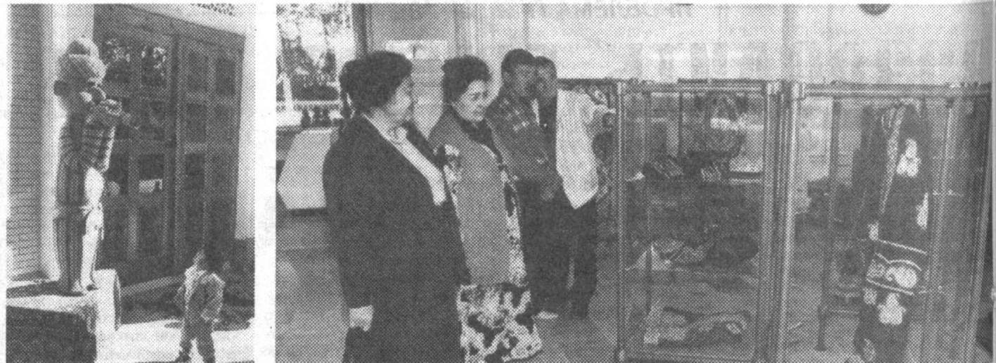
В дни празднования 660-летия великого предка Амира Темура жители и гости столицы получили возможность ознакомиться с замечательными работами мастеров народно-прикладного искусства. В обновленном