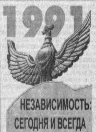
НЕЗАВИСИМОСТЬ: СЕГОДНЯ И ВСЕГДА