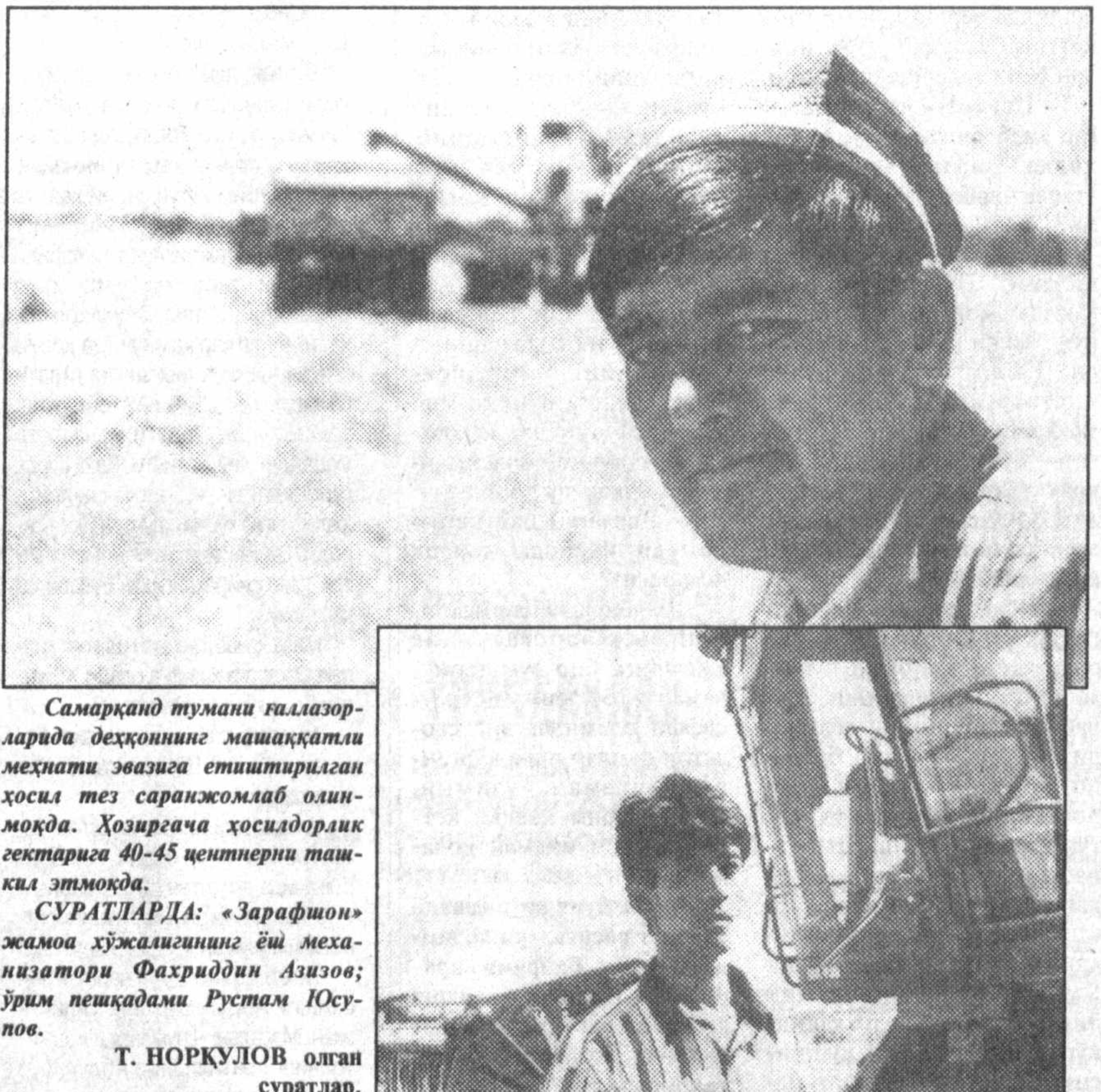
Самарқанд тумани галлазорларида деҳқоннинг машаққатли меҳнати эвазига етиштирилган ҳосил тез саранжомлаб олинмоқда. Ҳозиргача ҳосилдорлик гектарига 40-45 центнери ташиқ этмоқда.