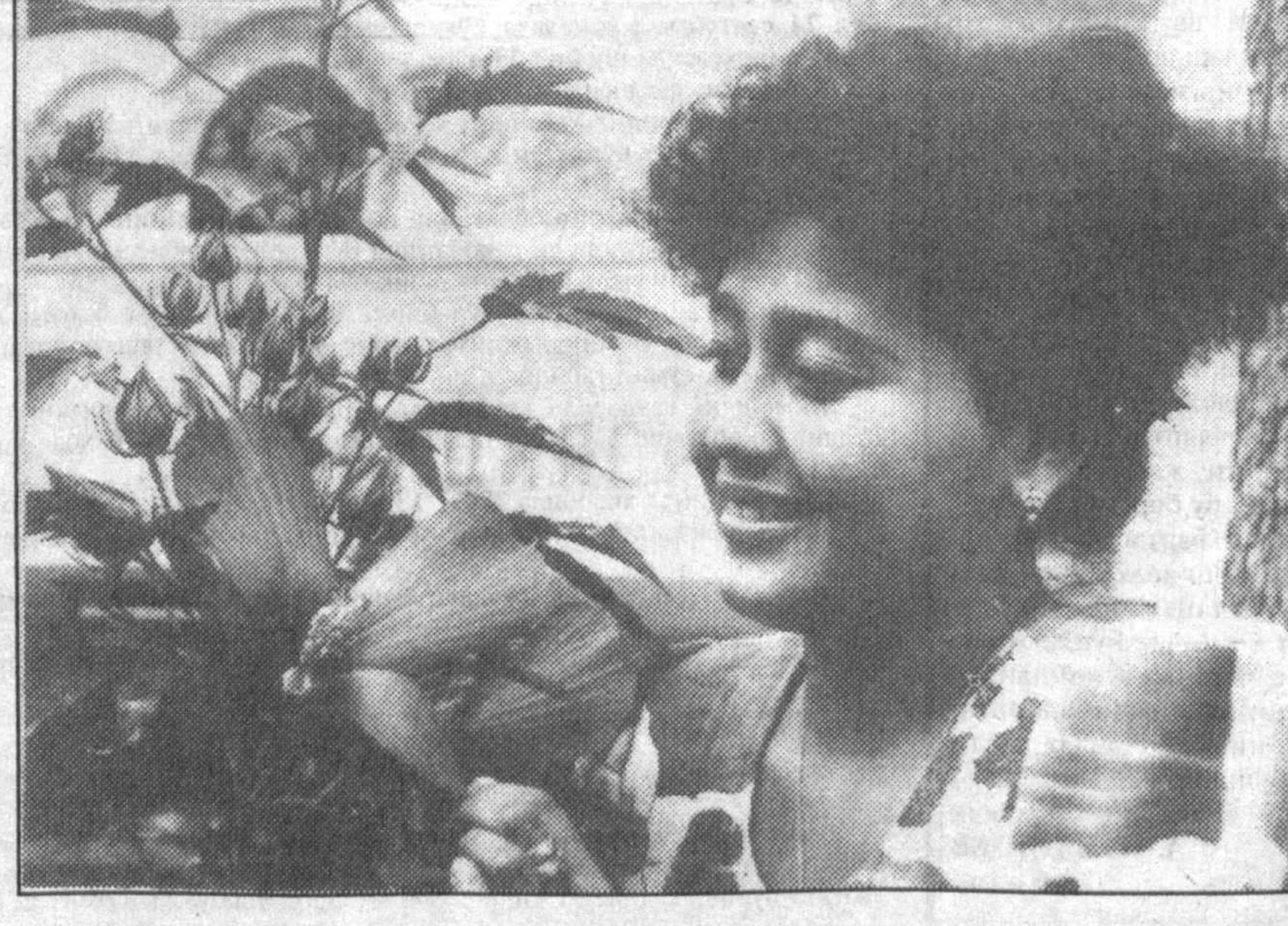
«Тулум, ўшаларга басма-бас очил...»