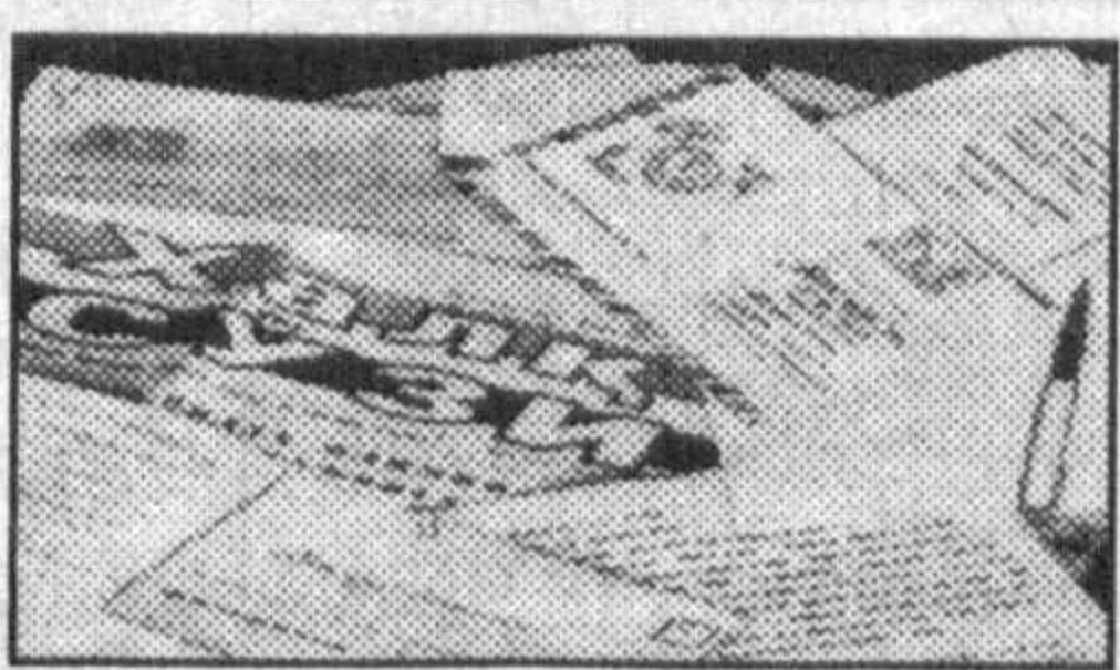
жуда кўплаб келтириши мумкин. Мен ушбу фикрлар юзасидан мутахассислар, филологлар ўз мулоҳазаларини билдиришди, деган эътиборим. Чунки буни асосида она тилимизнинг соғлиги, маънавият ва маърифатимизнинг қадрли, келажак авлодимизнинг тарбияси ётибди.

Яқинда давлат статистик ҳисоботи шаклидан бири кўлимга тушиб қолди. Унда «Жундан тўқилган эркеклар...», «Мўйналик аёллар...» деган ибораларни ўқидим. Бундай мисолларни