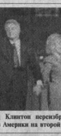
Был Клинтон переизбран президентом Соединенных Штатов Америки на второй срок.

Иран выступил с заявлением, отрицающим какую-либо причастность к террористическому акту, совершенному в американском военном городке в Саудовской Аравии. Во время нападения погибли девятьдесят американских военнослужащих.