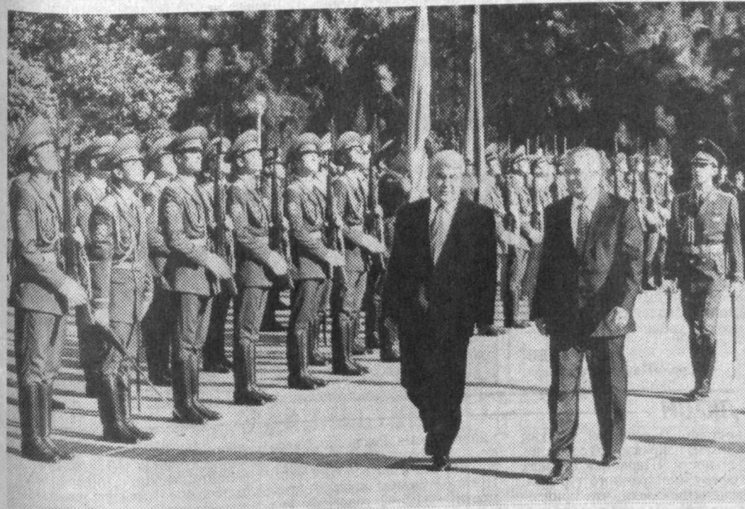
НА СНИМКАХ: официальная встреча в резиденции Дурмень; беседа президентов один на один.

27 ноября в Узбекистан с официальным визитом прибыл Президент Туркменистана Сапармурат Ниязов