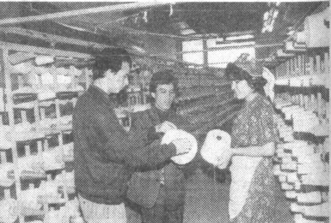
Акционерное общество «Сурхантекстиль» считается одним из ведущих предприятий области. Предприятие включает в себя четыре производственных цеха, где трудятся более 1,500 человек. На протяжении нескольких последних лет коллектив «Сурхантекстиля» не только не сбавляет темпы, напротив, объем выпускаемой продукции растет, увеличивается ее качество, расширяется ассортимент. На счету у предприятия 1,109 тонн хлопчатобумажной пряжи, более 5 миллионов 930 тысяч погонных метров отбеленной пряжи. До конца года показатели увеличатся соответственно до 1,250 тонн и 6 миллионов 831 погонного метра.

иностранных туристов, так как одним из направлений своей деятельности «Парвина» избрала и сферу иностранного туризма. Расчеты показали, что привлечение строительной силы со стороны обходится примерно в 20 раз дороже, чем создание собственного строительного подразделения.