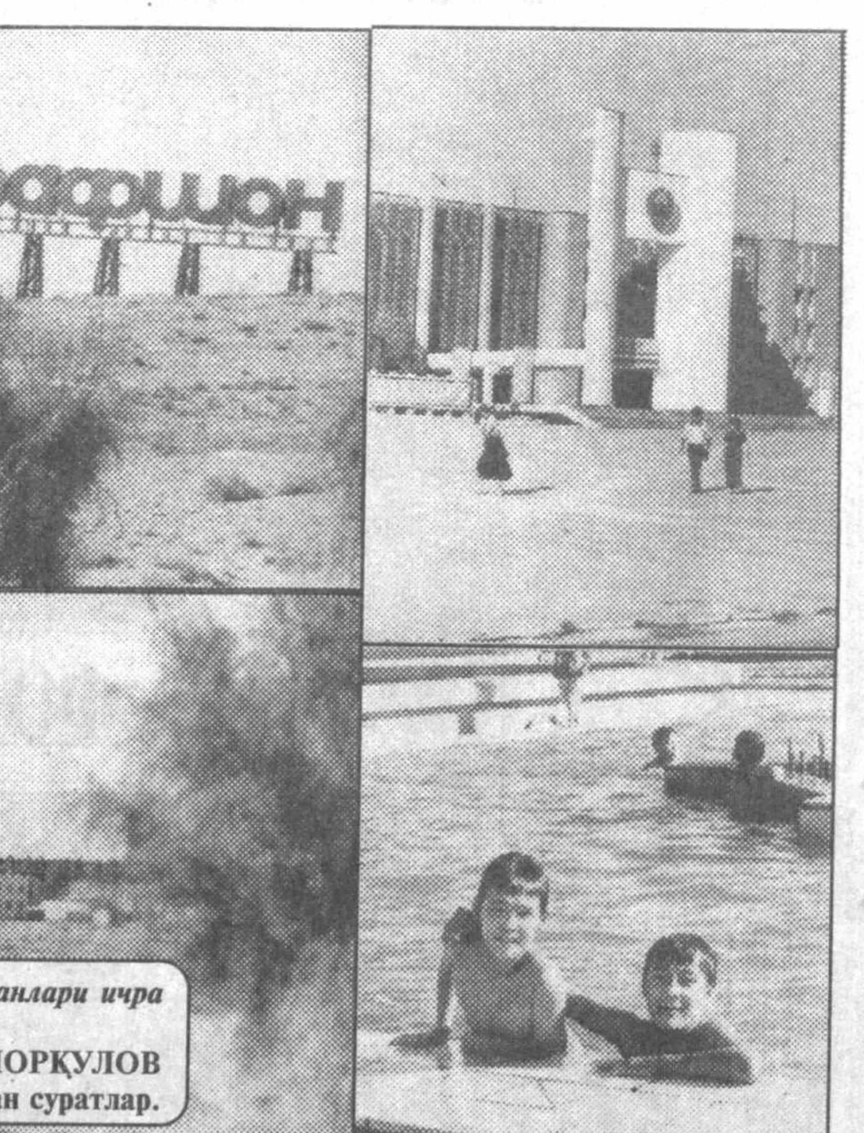
Зарафшон-Қизилқум барханлари ичра бунёд бўлган шаҳар.

ва бошқа китобларимдаги маълумотларнинг кўпини мана шу кутубхоналардан тўплаганман» деб ёзган. Дарҳақиқат бир неча жилдан иборат йирик жуғрофий лугат яратган Ёқут ал-Ҳамавийдек буюк олим аз-Замахшарийнинг «Жойлар, сувлар ва тоғлар» ҳақидаги китобига юқори баҳо бериб «Аз-Замахшарийнинг бу соҳада гўзал бир асари бор» деб ёзган ва ундан ўз асарининг 64 ўрнида бевосита фойдаланган. Яна бир гап. Аз-Замахшарийнинг бу асарида кўпинча Қуръони карим, пайғамбаримиз алайҳиссаломнинг муборак ҳадислари, Исломи дини тарихи билан боғлиқ жойлар номлари, Жоҳилия ва бошқа қадимги даврлардаги шоир-адибларнинг ижодларида уч-