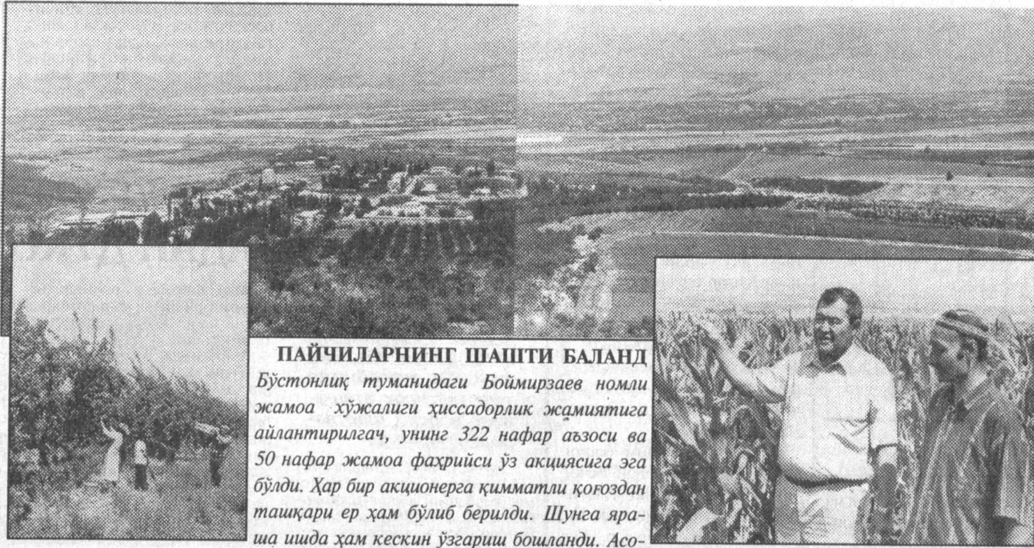
Пайчиларнинг шашти баланд бўстонлиқ туманидаги Боймирзаев номи жамоа хўжалиги ҳиссадорлик жамиятига айлантирилган, унинг 322 нафар аъзоси ва 50 нафар жамоа фахрийси ўз акциясига эга бўлди. Ҳар бир акционерга қимматли қоғоздан ташқари ер ҳам бўлиб берилди. Шунга яраша ишда ҳам кескин ўзгариш бошланди. Асосий ишлаб чиқаришдан ташқари аҳолига хизмат кўрсатувчи тармоқларга ҳам эътибор қўйилмоқда. Сутни қайта ишлаш цехи, тегирмон қуриб ишга туширилди. Ҳиссадорлар энди 1000 тонна маҳсулотни қайта ишловчи консерва заводи қуришга ҳозирлик кўришаёпти.

СУРАТЛАРДА: ҳиссадорлик жамияти шундай сўлим табиат қўйида жойлашган; узумчилик-боғдорчилик бригадасида йиғим-терим қизгин; бригада бошлиғи Ш. Юсупов ва бошқарув раиси Қ. Йўлдошев.