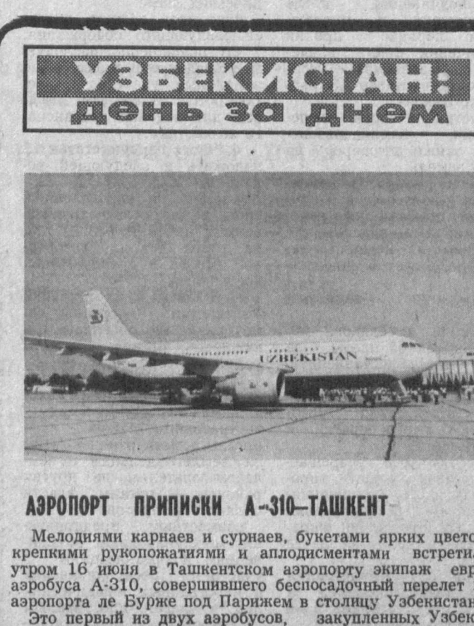
АЭРОПОРТ ПРИПИСКИ А-310—ТАШКЕНТ

Радио «Независимая волна»: В ответ на приглашение организаторов конференции сейчас в Вене координирует ООН по правам человека бывший президент СССР, обладатель Нобелевской премии мира Михаил Горбачев заявил, что готов принять в ней участие, если ему заплатят за это два миллиона восточных шиллингов. Организаторы решили обойтись без дорогостоящего гостя.