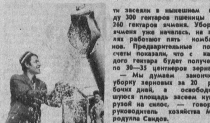
Земледельцы госхоза «Жайнов» Усман-Юсуфовского района Кашкардарьинской области