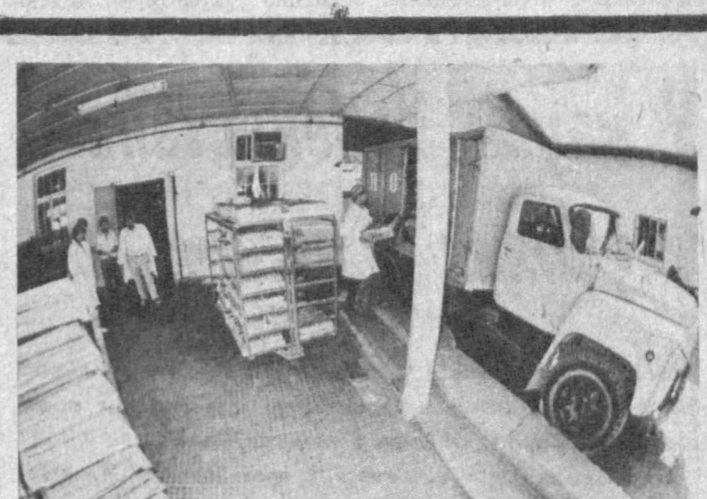
НА СНИМКАХ: в пекарне объединения; горячий хлеб готов к отправке в магазины.

трудится коллектив производственного объединения «Янгильхлебпром». Предприятие обеспечивает мукой жителей своего города и Янгильского района. В нынешнем году здесь выпущено более 32 тысяч тонн ценного продукта — на полторы тысячи тонн больше запланированного. Перекрыто плановое задание и по выпечке хлебобулочных изделий. Здесь свой хозяйский подход к делу — умелый объединяет сами усовершенствованные оборудование, технологично производство. Полученная прибыль разумно расходуется. Пущена новая линия по выпуску вермишели, готовится к производству лещенный цех. Весомая часть «копилки» идет на социальную защиту работников — плюс к зарплате здесь ежемесячная 70-процентная премия, оплачиваются питание в столовой и транспортные расходы.