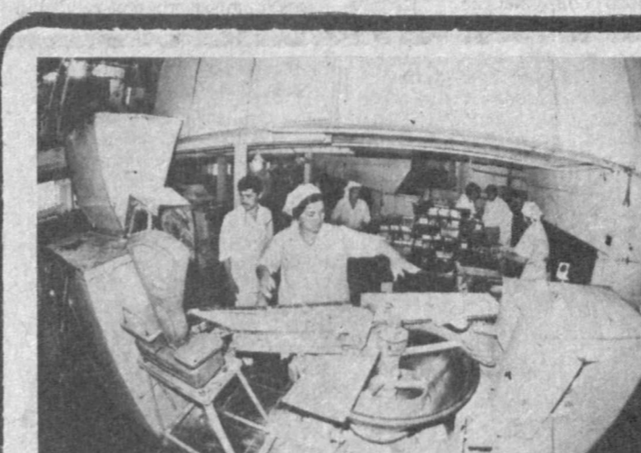
СТАБИЛЬНО, БЕЗ СРЫВОВ

Сделано немало, предстоит сделать еще больше. Организация экономического сотрудничества, без сомнения, сыграет огромную роль в деле обретения Узбекистаном достойного места в мировом сообществе и его продвижении к своему прекрасному великому будущему.