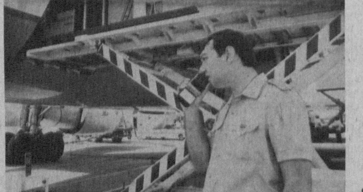
НА СНИМКАХ: рабочие будни таможни Ташкентского аэропорта.