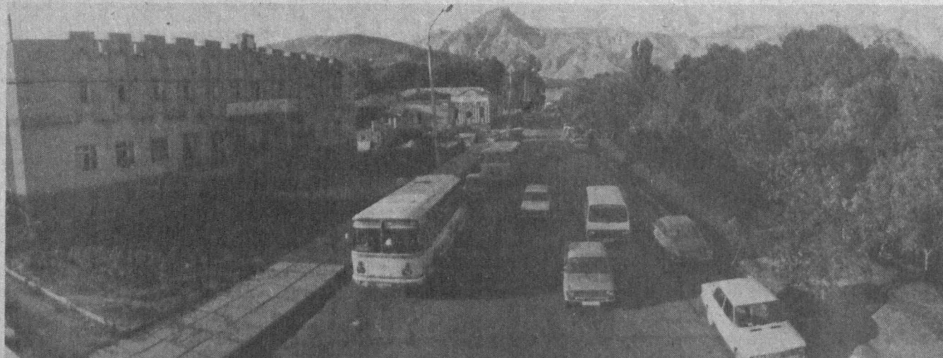
Кто в Узбекистане не слышал об Ургуте! Прекрасный горный край, живописная природа. Здесь зреет прекрасный виноград, поспевают бахчевые, овощи, фрукты. Но более всего этот край известен своим знаменитым табаком, который экс-

портируется не только в государства СНГ, но и в дальнее зарубежье.