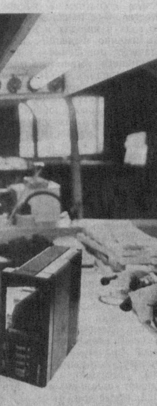
На снимке: монтажница Светлана Машеева.