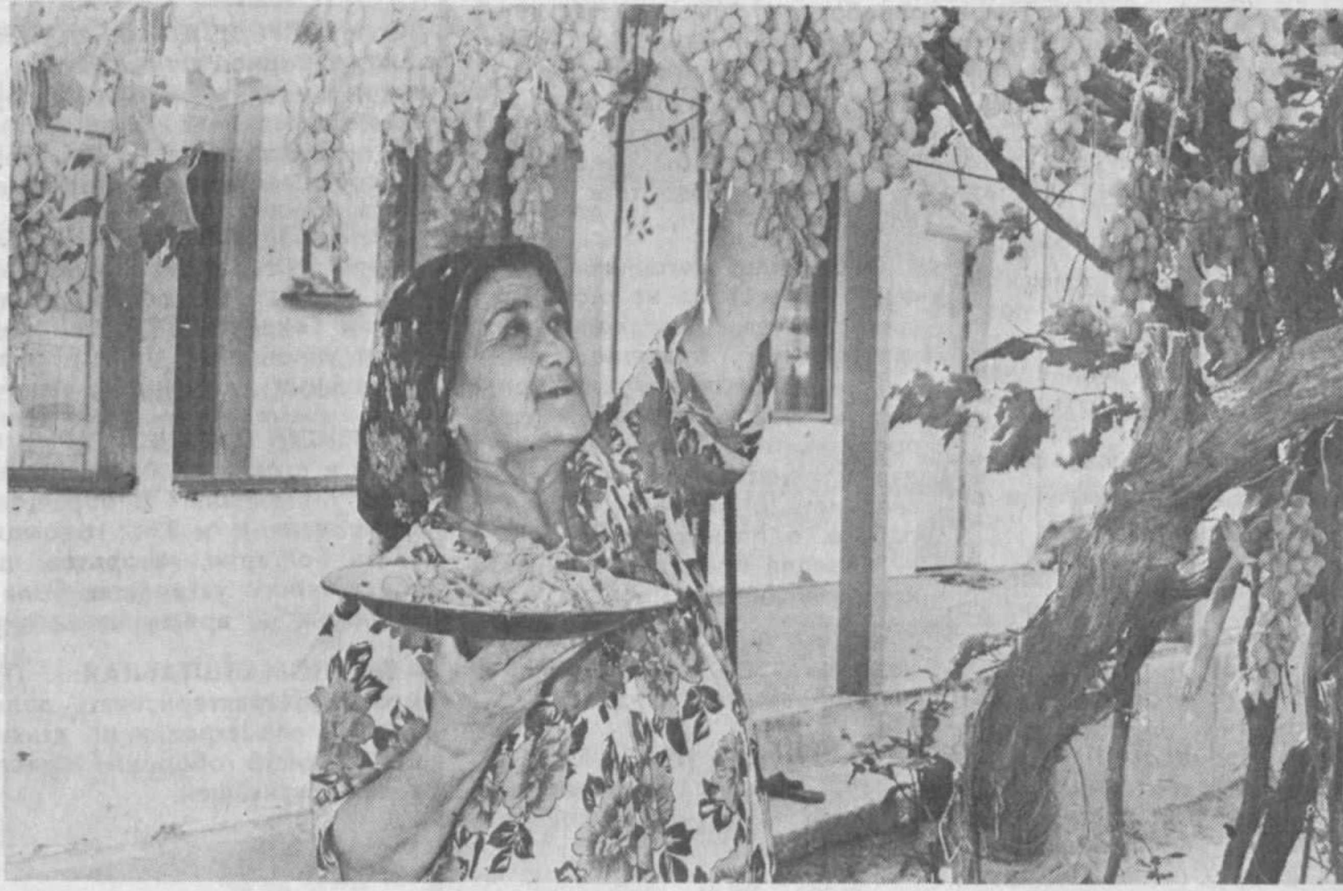
Десятки семей справили новоселье в Туркунганском районе Наманганской области.

На пленуме был принят устав Комитета женщин Узбекистана и «Основные направления деятельности Комитета женщин Узбекистана».