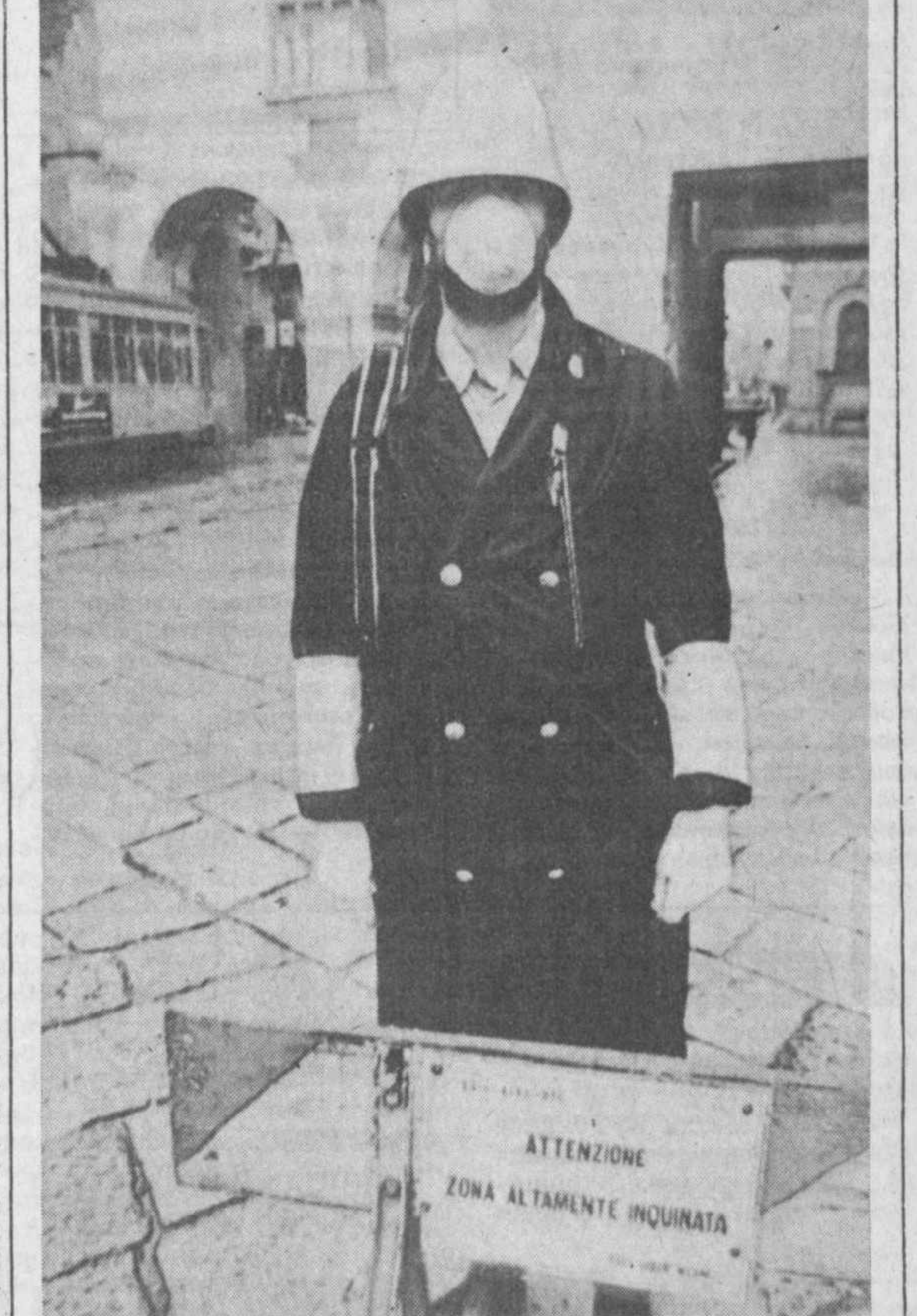
Воздух в Милане и его окрестностях достиг угрожающего уровня загрязнения выхлопными газами и промышленными выбросами в атмосфере. В некоторых зонах города зарекомендовано значительно превысило так называемый «порог безопасности». НА СНИМКЕ: итальянские регулировщики вынуждены выходить на службу с респираторами.