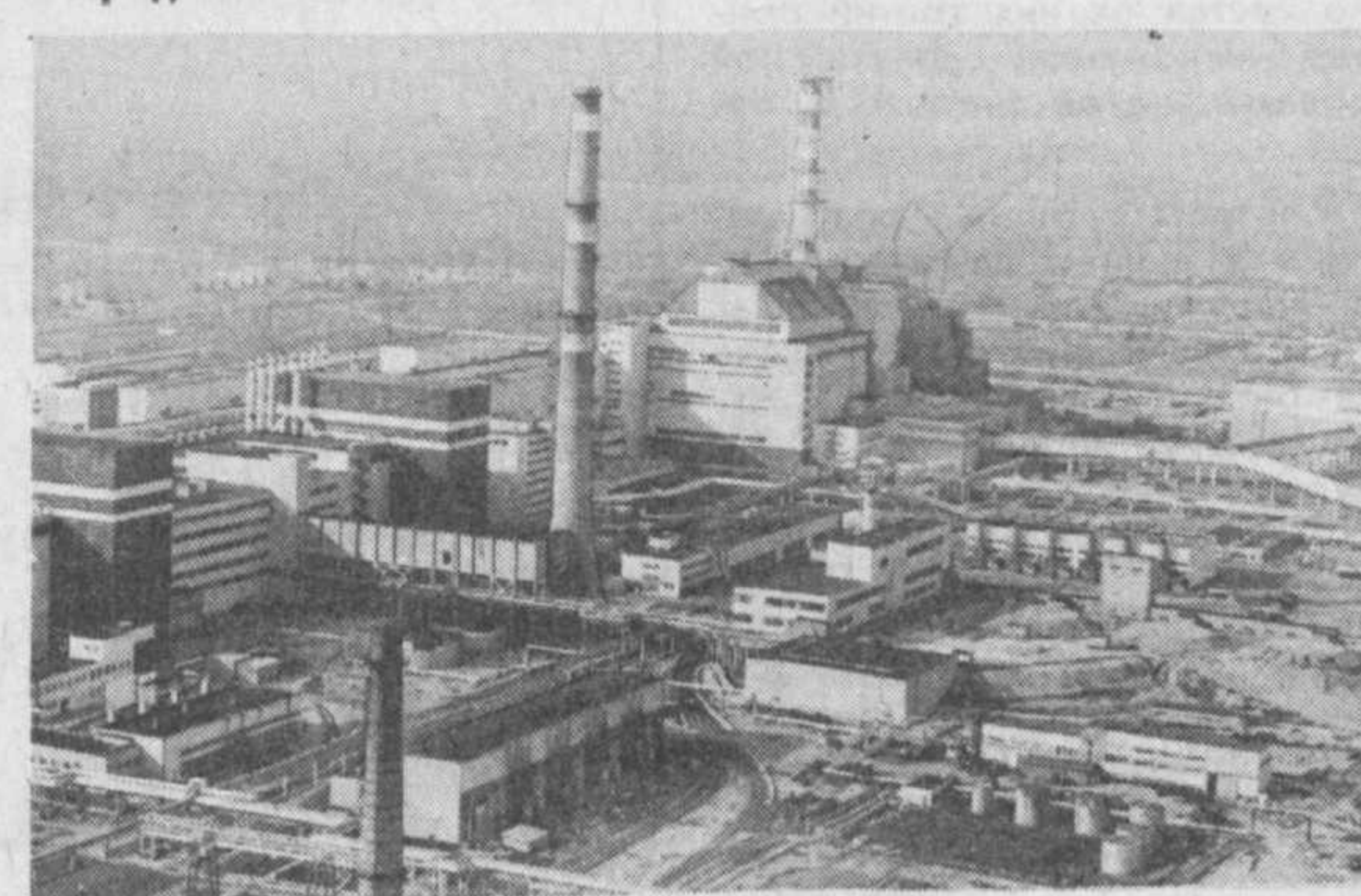
НА СНИМКЕ: Чернобыльская АЭС сегодня. Снимок сделан с борта вертолета.

Что и говорить, правительство делает немало для пострадавших от аварии, но, видимо, еще недостаточно. Некоторые решения о создании переселенцам нормальных условий для жизни остаются на бумаге. В родные места, зараженные радиацией, потянулись люди, в основном пенсионного возраста, доживают свой век. В народе их называют «самоселами». Условия жизни — хуже не придумаешь. Автолавки приезают раз в неделю, прописки нет, из-за этого множество проблем. Помочь решить их — задача первоочередная.