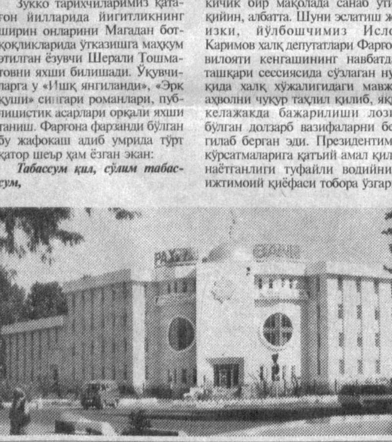
ШУ АЗИЗ ВАТАН — БАРЧАМИЗНИКИ

Ҳўлла, бутун юртиниз ақли қўнми фарғоналик ҳам муқталикнинг олти йилдининг катта қувони ва эзу ниятлар ила кўтиб олдилар. Ўтган давр мобайнида виллоятда улкан бунёдкорлик ишлари амалга оширилди. Уларнинг ҳаммасини кичик бир мақолада санаб ўтиш қийин, албатта. Шунинг эътиҳи жоизки, йўлбошчимиз Ислом Каримов ҳақ депутатлари Фарғона виллояти кенгашининг навбатдан ташқари сессиясида сузлаган нутқидини хақ хўжалигини мавжуд аҳолини чуқур тақлил қилиб, яқин келажакда бажарилиши лозим бўлган долзарб вазифаларини белгилаб берган эди. Президентимиз қўрсатмаларига қўшгани амал қилинганлиги туғайли водийнинг ижтимоий қиёфаси тобора ўзгариб