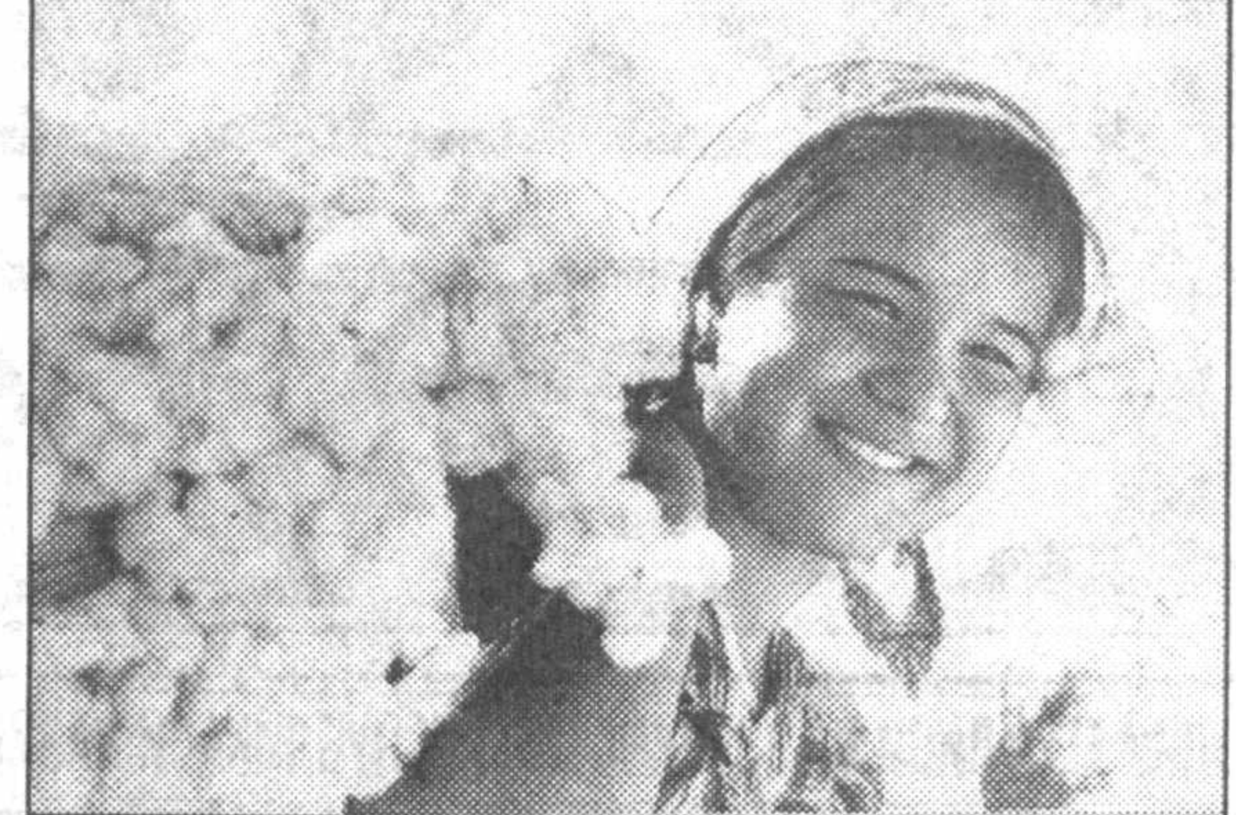
«Намуна» жамоа ҳужалиги Бағдод туманидаги пешқадам ҳўжалиқлардан бири ҳисобланади. Жамоа ўтган йили туманда биринчи бўлиб режани бажарган эди. Бу йил ҳам шу анъанага содиқ қолиб пахта терimini биринчи бўлиб бошлади.