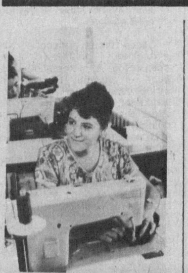
ХОРЕЗМСКАЯ ОБЛАСТЬ. Создание цехов малой мощности при Янгйурикском хлопководстве позволило трудоустроить еще 90 жителей тузлаевского района.

Недаром в народе говорят «Не место украшает человека, а человек — место». В правоте этой пословицы мы убедились, побывав недавно