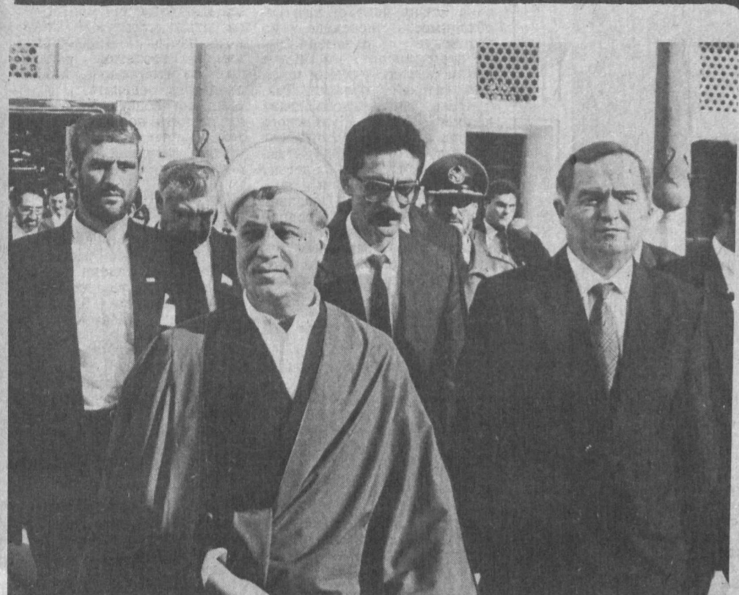
Визит Президента Ирана в Узбекистан

Я верю, что, равняясь на вас, трудящиеся всей республики будут работать напряженно, целеустремленно и до наступления непо-