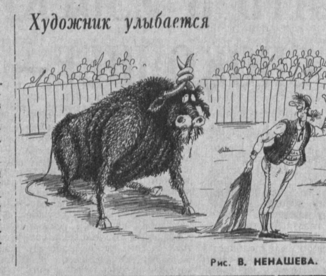
Рис. В. МЕНАШЕВА.

Завершился традиционный открытый турнир футболистов «Хотира-93». В четвертый раз его участниками разыграли Кубок памяти команды «Пахтакор», погибшей в авиационной катастрофе в 1979 году. Боролись за этот спортивный трофей, учрежденный Федерацией футбола Республики Узбекистан, мальчишки, родившиеся в тот, 1979 год. Главная награда досталась хозяевам турнира — воспитанникам республи-