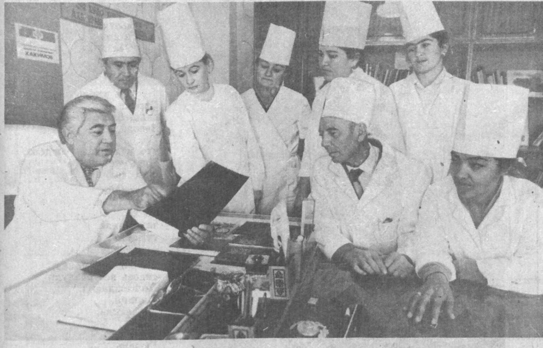
ДВОРЕЦ-САНАТОРИЙ Кто не знает памятники древней и всегда прекрасной Бухары «Ситоран мохи хоса» — бывший летний дворец бухарского эмира! Но вот уже тридцать лет, как расположен в нем единственный в республике санаторий почечных заболеваний, где ежегодно лечится около 10 тысяч человек.