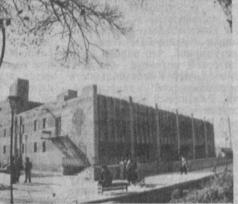
Праздник шагает по улицам, стадионам, скверам, клубам, прославляя прошлое и настоящее города — жизнь и труд людей, свои ми руками строющих свою настоящую и будущую судьбу. Счастья тебе и успехов, Турткуль!