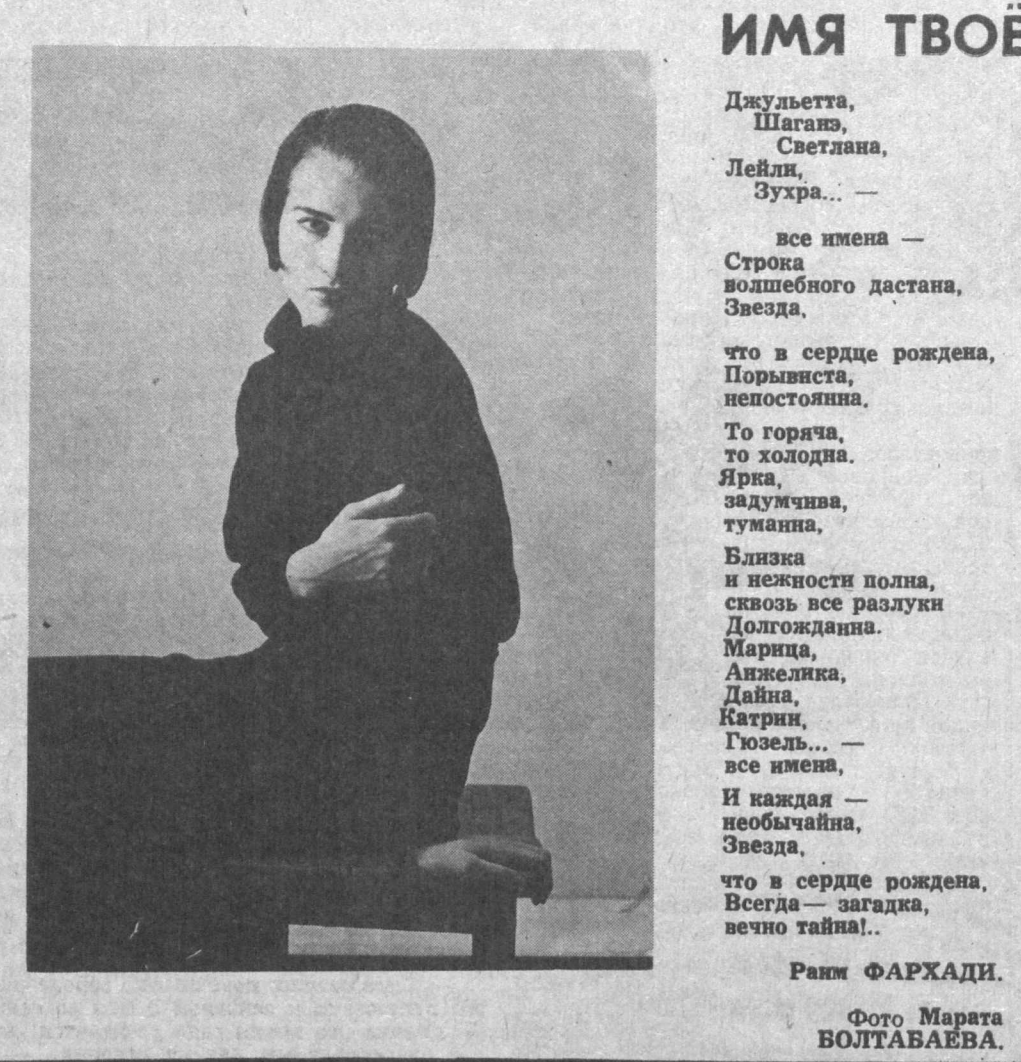
Имя твоё Джульетта, Шаган, Светлана, Лейля, Зухра... все имена — Строка волшебного дастана, Звезда...