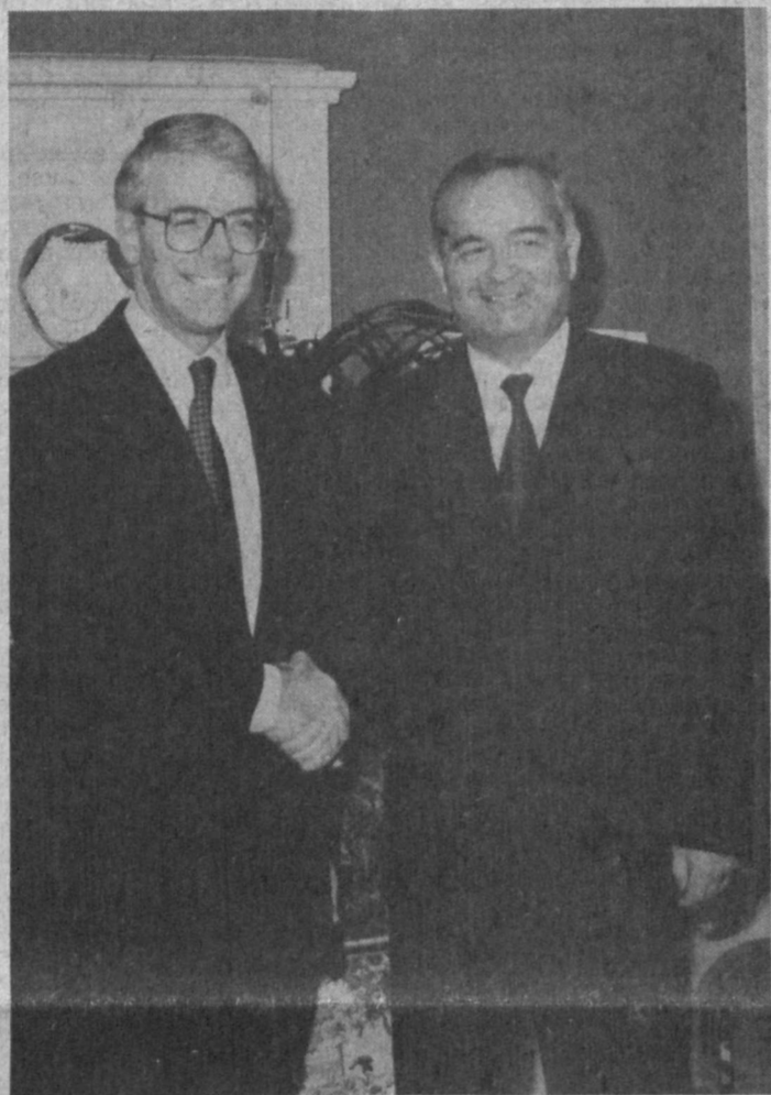
НА СНИМКЕ: во время встречи Президента Республики Узбекистан Ислама Каримова с премьер-министром Великобритании Джоном Мейджором.