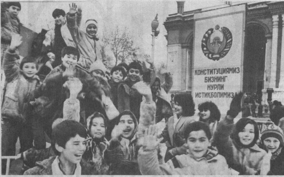
Так проходил праздник у театра имени А. Навои.