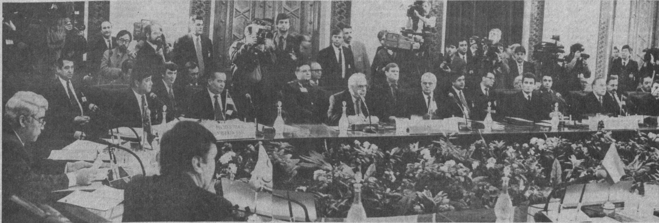
НА СНИМКЕ: во время встречи.