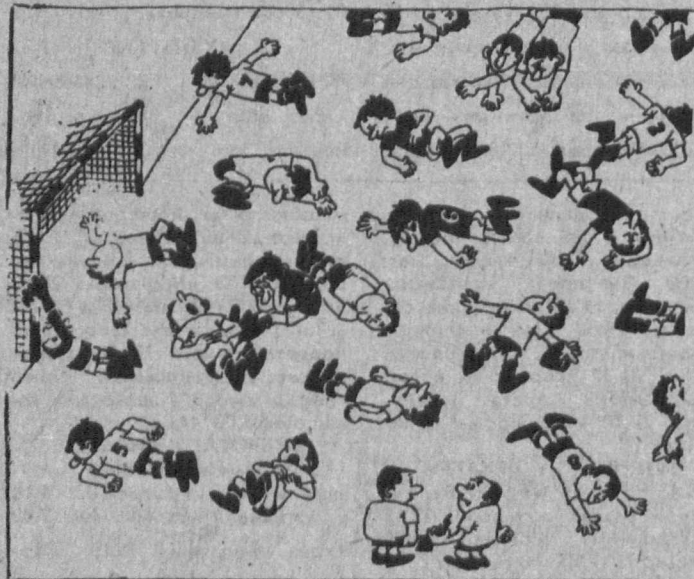
Первому, кто очнется, покажешь нежную нарочку. Рис В. ТИЛЬМАНА.