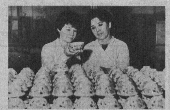
Выпуск «СК» подготовил Ю. КАЗАЧЕНКО.

Дежурный редактор Л. ЛЕВИТАС, дежурный Л. БАЙТЕРЖОВА.