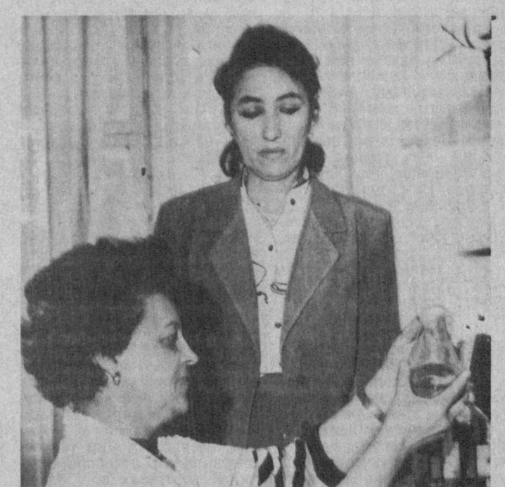
НА СНИМКЕ: сотрудники лаборатории ведут анализ взятых проб.