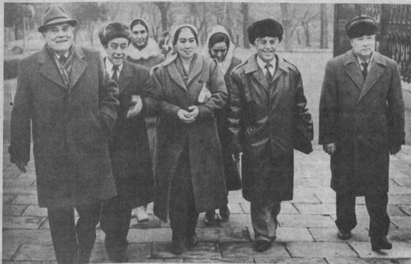
НА СНИМКАХ: народные депутаты, прибывшие на сессию; идет регистрация.