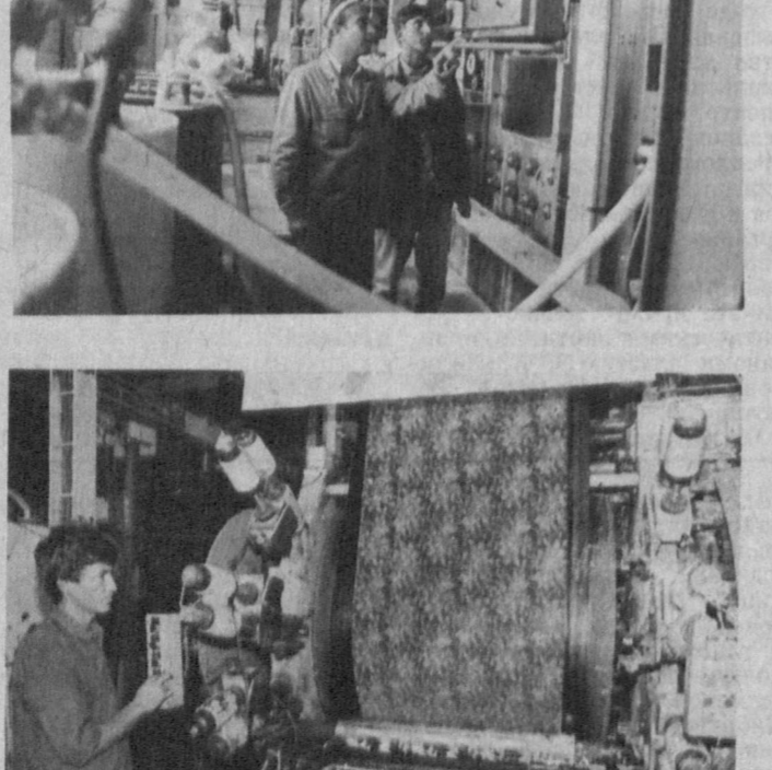
Установка на Бухарском текстильном производственном объединении нового оборудования, такого как «Каландра», «Беннигер», «Мега-2», «Эпилекс», «Шторн», сказала как на темпах производства, так и на качестве выпускаемой продукции. Теперь предприятие выпускает несколько видов тканей, которая пользуется большим спросом у населения.

Участники семинара-совещания выявили немало