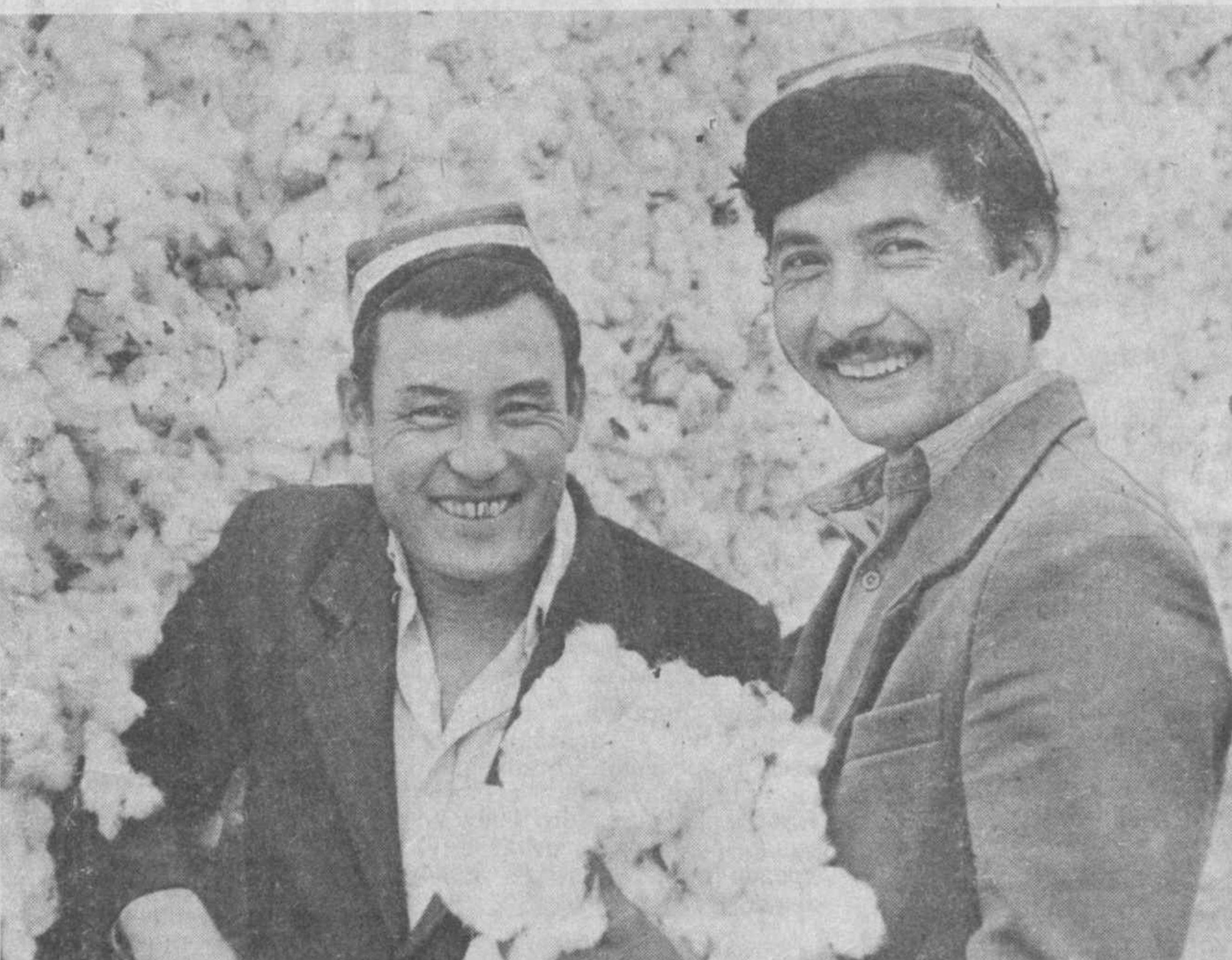
Труженники колхоза имени Ленина Ленинградского района в этом году возделывают хлопчатники на 1.053 гектарах. Урожайность гектара репихи довести до 32,2 центнера. Сейчас в хозяйстве в разгаре уборочная страда. Один за другим финишируют передовые коллективы.