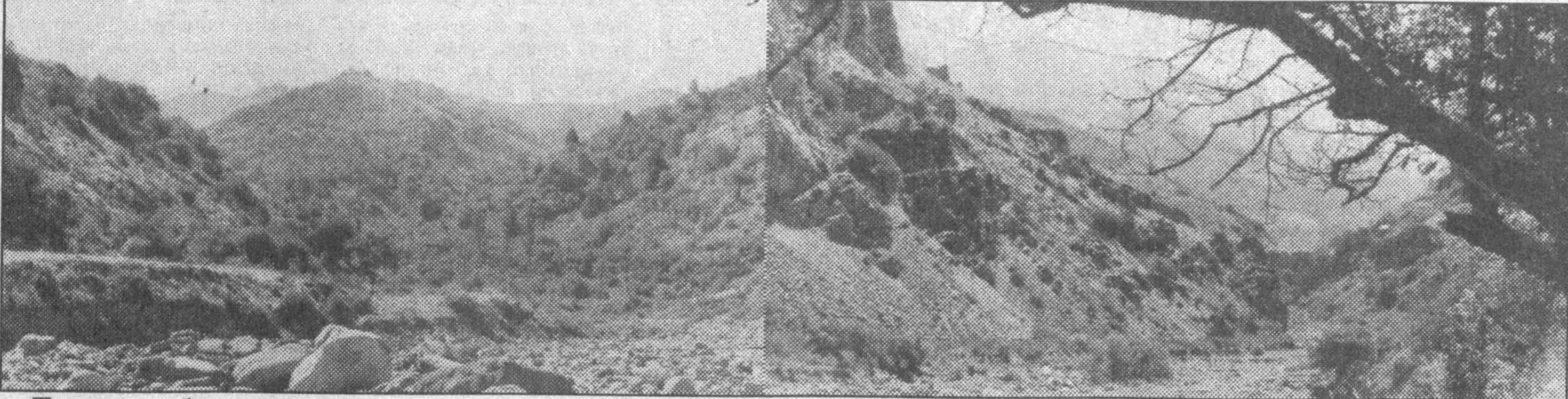
Тоғларга боқ, тоғларга...