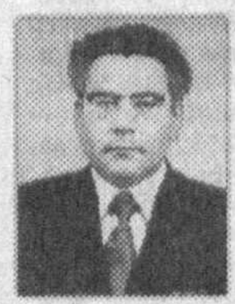
1980 йилнинг июнида дуппа-дуруст иш...

21 кундан кейин уйга олиб келинди. Онда аълоларим эскича усуллари ҳам кўп қилишди.