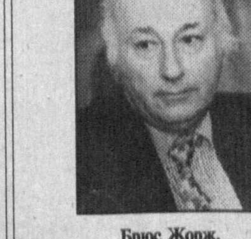
Брюс Жорж, ЕХХТ Парламент Ассамблеясининг 1-қўмитаси раиси: — ЕХХТ парламент Ассамблеясининг кенгайтирилган бюросининг мажлиси айнан Тошкентда ўтаётгани

бежиз эмас. Чунки мамлакатингиздаги сиёсий барқарорлик, иқтисодий потенциал минтақадagi етакчи куч сифатида жаҳон ҳамжамиятида муносиб ўрин топмоқда.