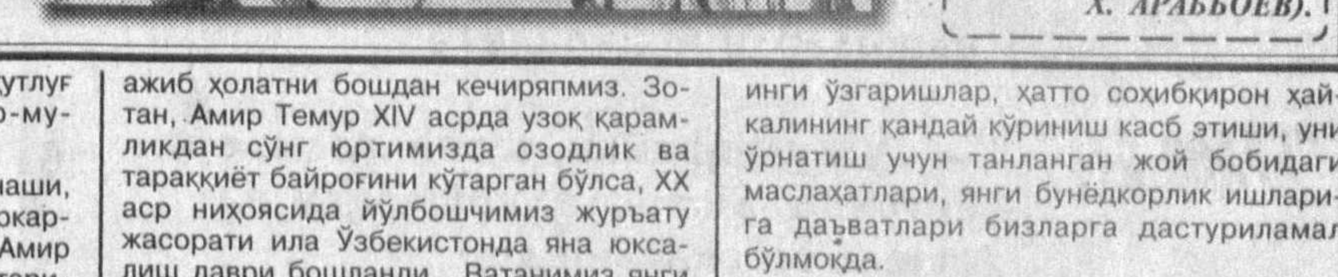
Саҳифа материалларини «Халқ сўзи» муҳбирлари О. ШОДМОНАЛИЕВ ва Э. БОЛИЕВ тайёрлашди.

Тарихда бир-бирига ўхшаш даврлар, замоналар учраб туради. Истиқлол шарафати билан бугун биз ана шундай