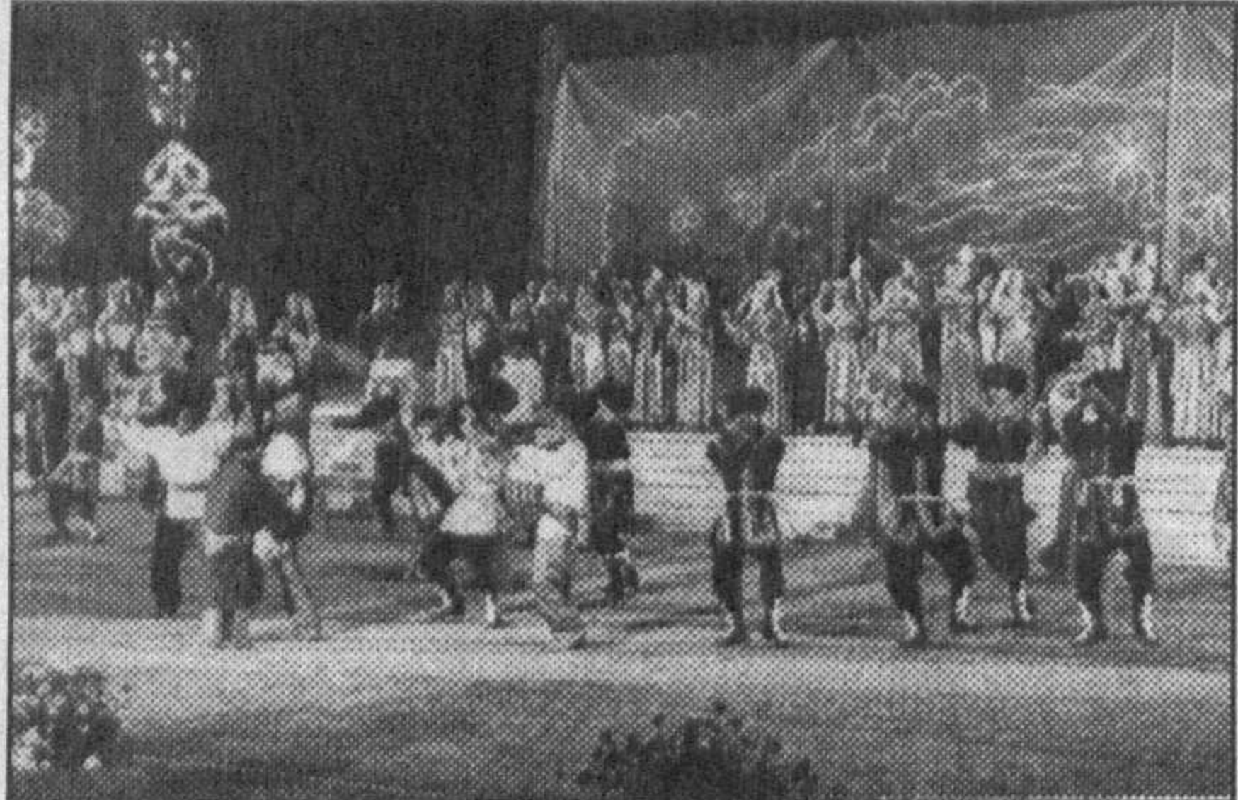
(Давоми. Аввал 1-бетда).

Ўзбекистон давлат мадҳияси янграйди. Театрлаштирилган томоша бошланади. Бухоро ҳақидаги қўшиқ таралади. Буюк сафларимиз Баҳоуддин Нақшбанд, Амир Темур, Абу Али ибн Сино, Улугбек мўтабар шаҳарини кутлуг сана билан табриқлаб, дуои фотиҳа қилдилади. Пойтахтимиз Тошкент, дунёнинг қадимий маданият марказлари -- кўҳна Рим, Самарқанд, Вена, Мадрид, Хива санъаткор ижросида Бухоро шодибанасига шерик бўлади. Саҳнада эртанги янада буюк куллар тисоли оқ лайлақлар пайдо бўлади. Минора Калондан олоб шалосага -- кутбарка ёғилади.