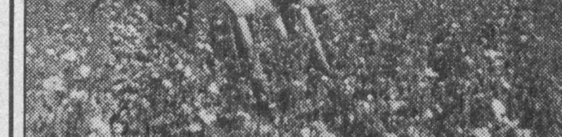
Мамлакатимиз деҳқонлари хорижий қаровиб «меҳнаткаш» техникалари меҳнатини кўриб гоҳ ҳайратлансалар, гоҳ кўнгилларида хижиллик туйишаёттир. Негаки, эскиреган техникалар уларни эсанқиратиб қўётгани, айниқса, жузда жузда сезилиб қолади. Лекин Тошкент вилоятининг Юқори Чирчиқ туманида ташкил этилган давлат ҳисдорларига машина-трактор парки аъзолари шартнома асосида хўжалиқларга техника ёрдами кўрсатишга тгани ҳаммаи қувонтирипти.