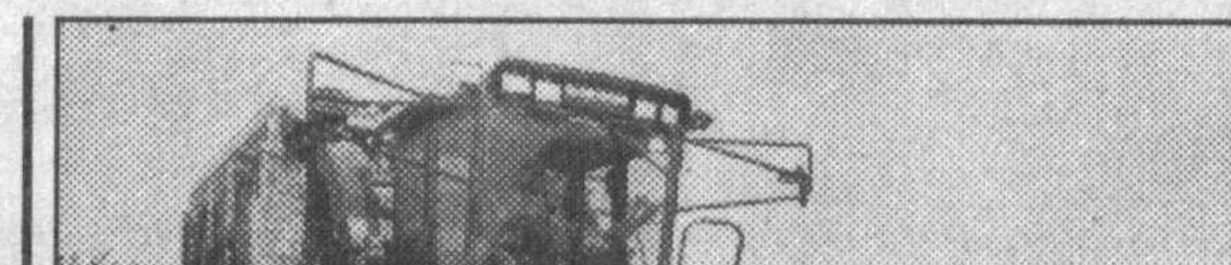
Ким ҳам ишонарди дейсиз, уч-тўрт йил аввал Ўзбекистон далаларида Американинг машҳур машина-тракторлари галла ўришига! Эҳуд бир кунда ўттиз тоннадан зиёд пахта терилиши тасаввур қилармидинг? Йўқ, албатта. Бугун эса...

«Эр туғрисиданги Қонунининг 2-моддасида шундай гап бор: «Ер -- Ўзбекистон Республикасининг мулки». Демак, республика хўжалиқига барча ер мамлакатда дахлдор, мамлакатнинг қийинлиги. Ер томорқа соҳибига ҳам, деҳқон хўжалиқига ҳам фойдаланиш учун, ундан муш хосил ишчилик, халққа бериш, пировардида меҳнатининг манфаатини кўриш учун берилади. Болалгимизда ўқиган Мирзакаримбойнинг бир жайдаги фалсафасини эсланг. Жияни Илчи муҳтождикин бир парча ерини сотмоқчи бўлганда, у: «Жия, ерни сотманг, ер сотган эр бўлмайди, ер киши ер сотмайди», дейди. Маърифатли, зиёли, биз юқорида номини тилга олган бошқарма мутахассиси Олим Ҳақимов баъзан гап айтиди: «Ерга эгалик қилишга эмас, ердан қандай фойдаланишга талашин керак. Сен ҳамма мулкнинг -- пулининг, молининг, машининг, бор биситингни олиб кетишинг мумкин, аммо ерни ҳеч жойга олиб кетолмайсан. Ер ин сен олмайсан, бир кун келиб у сени барига олади».