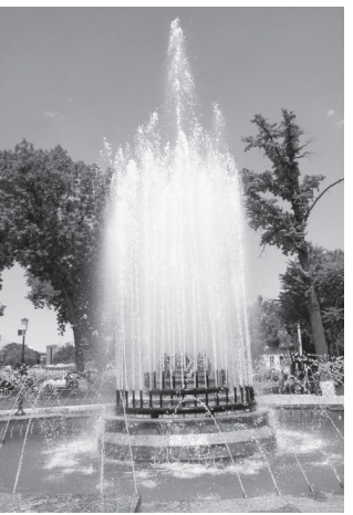
(Давоми. Бошланиш 1-бетда).

хузур олишади. Бу ердан олам-олам таассуротлар билан қайтаётганлар орасида хорижликлар ҳам кўп. Хусусан, ўтган йили мажмуанинг Симпозиумлар саройида ўтказилган «Ўзбекистонда она ва бола саломатлигини муҳофаза қилишнинг миллий модели: «Соғлом она — соғлом бола» мавзусидаги халқаро симпозиум, шунингдек, жорий йил бошида бўлиб ўтган «Юксак билимли ва интеллектуал ривожланган авлоднинг тарбиялаш — мамлакатни барқарор тараққиёт этириш ва модернизация қилишнинг энг муҳим шарт» мавзусидаги халқаро анжуман иштирокчилари нафақат бинонинг маҳобатига, балки унинг атрофида яратилган бетакорор манзарага қойил қолиб, ҳавас қилишганига гувоҳ бўлган.