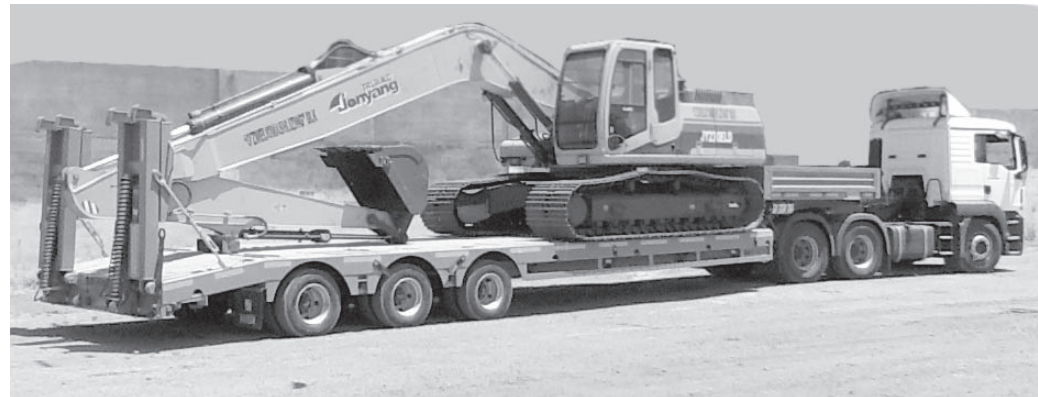
• Реклама ва эълонлар •