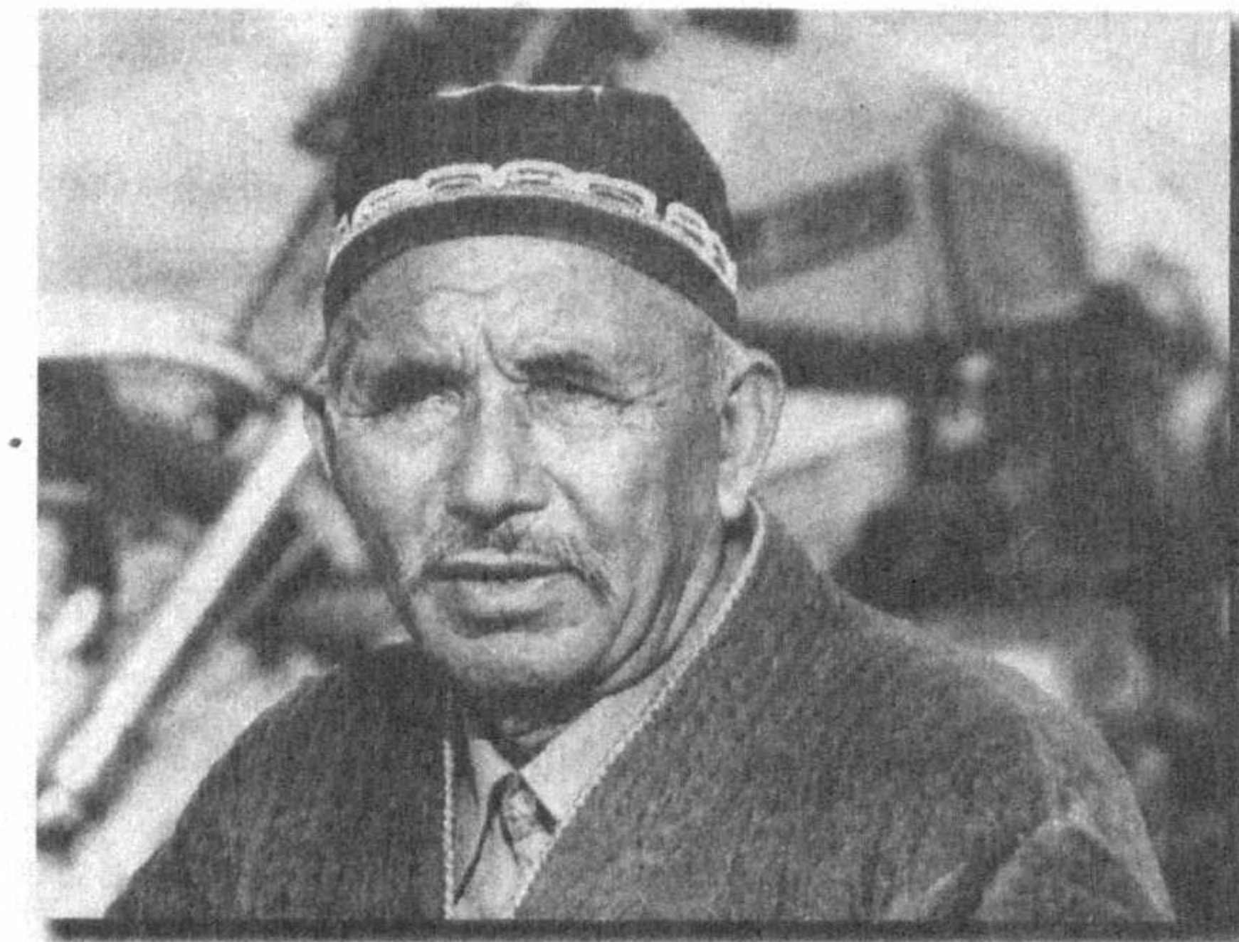
Нишон туманидаги «Нишон» давлат наслчилик жамоа хўжалиги республикамиздаги қоракўл қўйларни етиштири-ладиган энг йирик хўжаликлардан бири ҳисобланади. Айни пайтда бу ерда 45 минг бошга яқин қоракўл қўйлари парва-риш қилинмоқда.