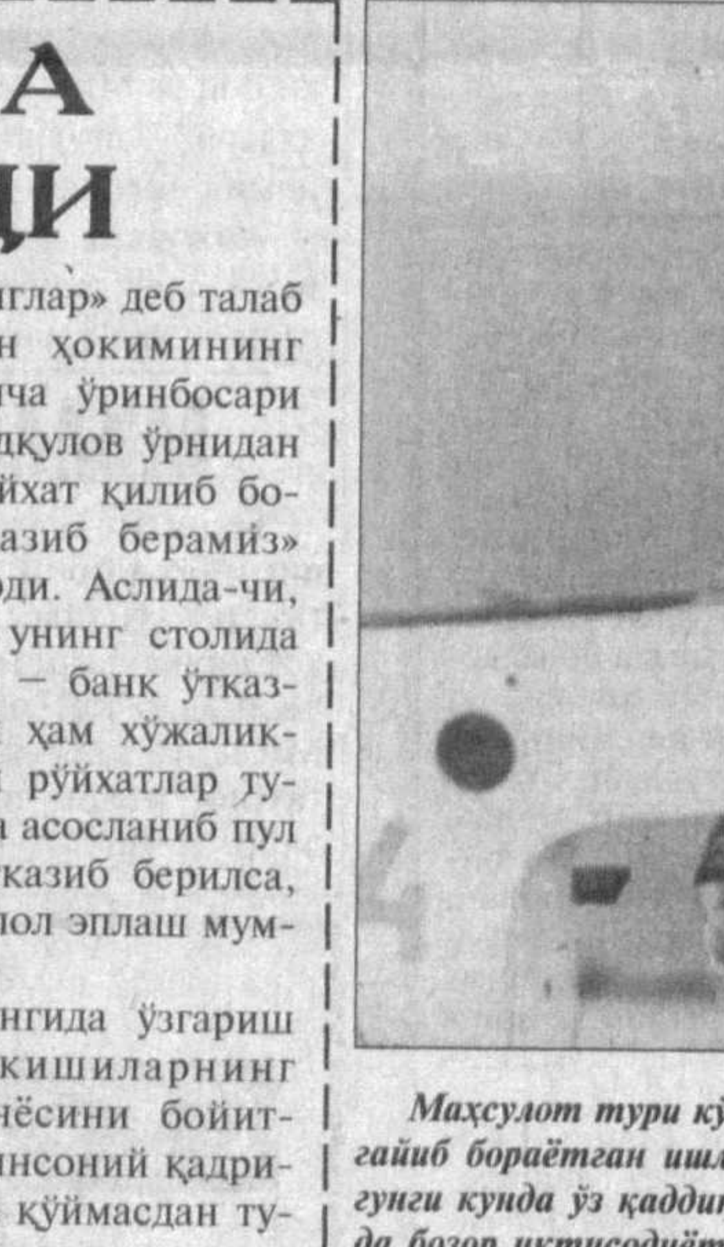
Маҳсулот тури кўнайиб, фаолият доираси кеңейиб бораётган ишлаб чиқариш корхоналари бу-суғиб кунда ўз қаддини тиклаш билан бир қатор-да бозор иқтисодиётининг хар қандай синовла-рига бардош берадилар.

ни сўрадик. — Ҳўжалиқларимизнинг ҳисоб рақамига пул тушиди, икки-уч кунда ҳал қилиб бе-рамыз, — деди у киши. Одамлар онгда ўзгариш ясамастан, кишиларнинг маънавий дунёсини бойит-масдан, умуминсоний кадр-иятларни йўлга қўймасдан ту-риб, ҳўқуқий демократик дав-лат барпо қилиш ҳақида ўйлаб бўладими? Бу тамойил-ларни, фазилатларни халққа ким етказайди? Оммавий ах-борот воситалари! Шундай экан вилоятдаги хар бир ра-ҳбар биттадан «Халқ сўзи»га ёзилган ҳам умумий рақам олти мингдан ошиб кетаркан.