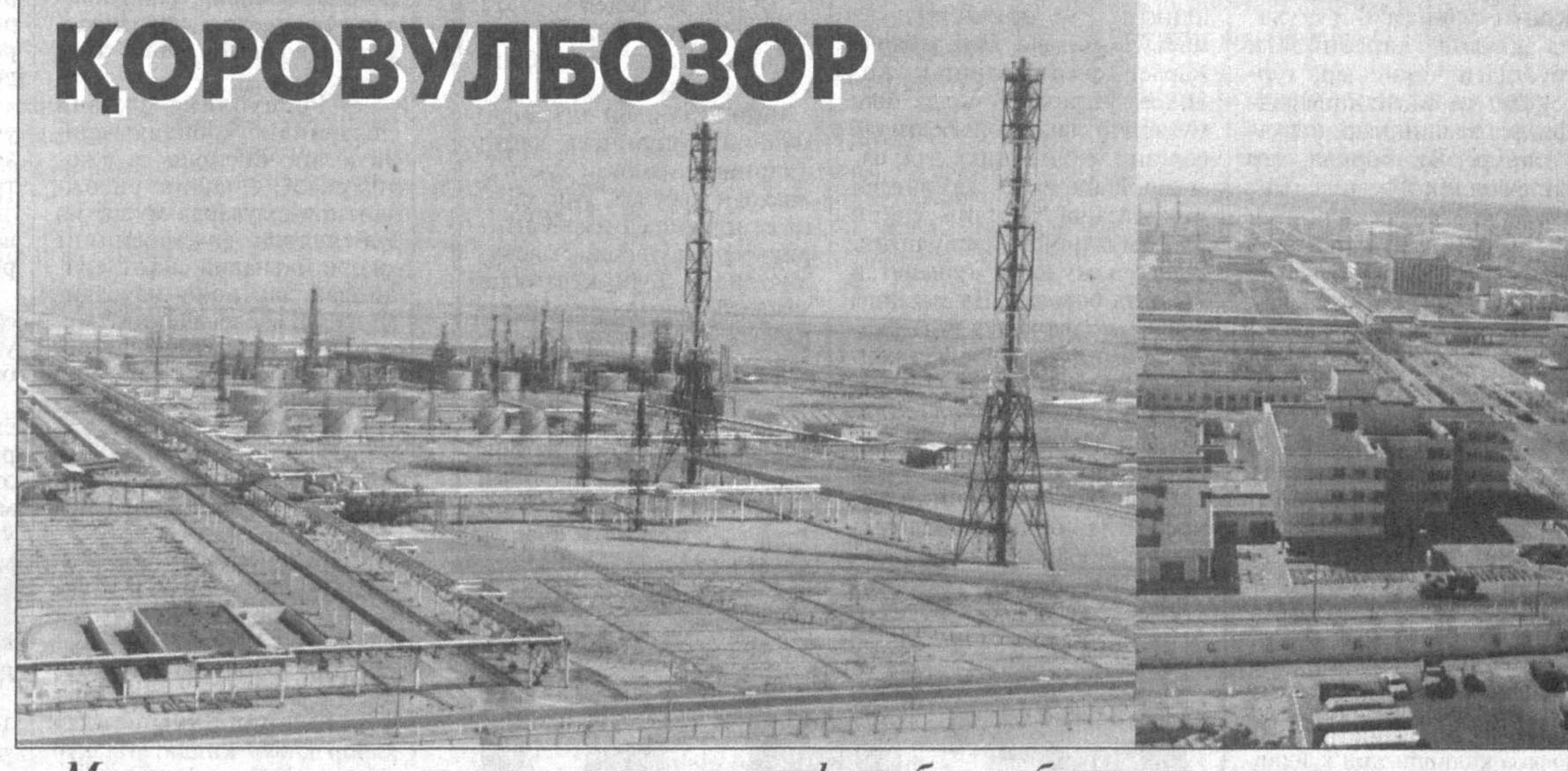
Мустақиллигимиз тарихига олтин ҳарфлар билан битилган иншоот.