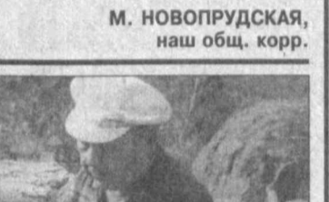
Все обитатели Народного парка в Зааминском горно-лесном регионе ищут и находят себе укромные, затененные уголки. Чтобы не только человек не мог потревожить наследку-келлика, зайчику с ее ушастиками, лисицу в доме-норе с четырьмя, а то и пятью "дверями" — тайными отводами для ухода от врагов...